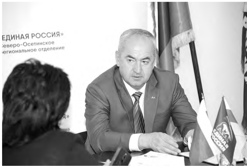
«ЕДИНАЯ РОССИЯ» Северо-Осетинское региональное отделение

За помощью к председателю парламента обратились девять жителей республики с вопросами как личного характера, так и общественно значимыми. Приходили не только с просьбами, но и с жалобами – на бездействие управляющих компаний, незаконные пристройки и ненадлежащее качество ремонтных работ придомовых территорий. В прошлом году при выполнении асфальтных работ на ул. Владикавказской подрядчик недобросовестно подошел к своим обязанностям, в результате чего во время дождей возле подъездов собираются огромные непроходимые лужи. К тому же при обустройстве придомовой территории не была предусмотрена детская площадка.