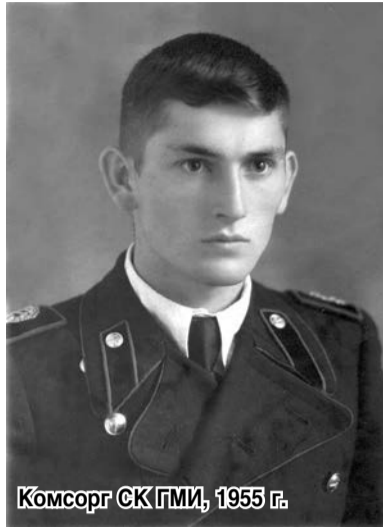
Комсорг СК ГМИ, 1955 г.