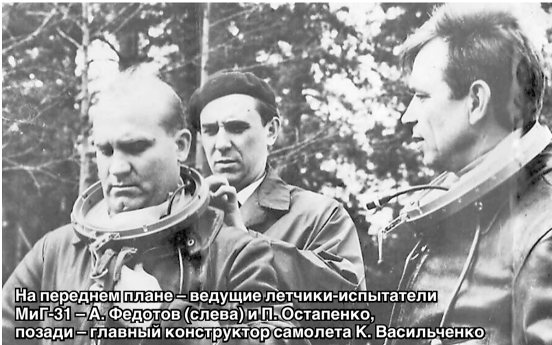
На переднем плане — ведущие летчики-испытатели МиГ-31 — А. Федотов (слева) и П. Остапенко, позади — главный конструктор самолета К. Васильченко

с подвесными баками (всего 20350 кг топлива) до 3,5 часа. Дальность с двумя подвесными баками — 3 000 км, без них — 2 500 км.