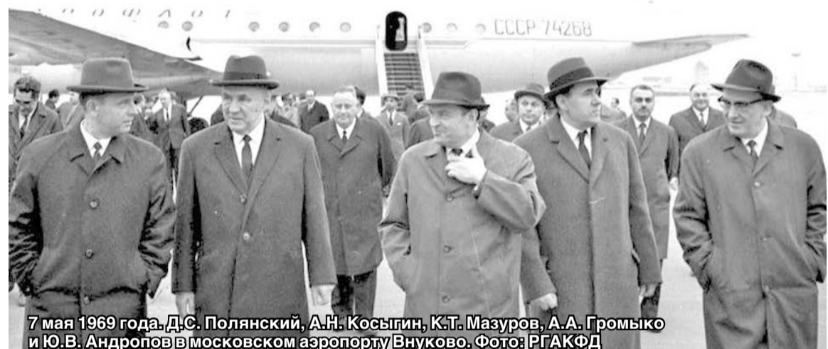
7 мая 1969 года. Д.С. Полянский, А.Н. Косыгин, К.Т. Мазуров, А.А. Громыко и Ю.В. Андропов в московском аэропорту Внуково.

А впереди выпускные экзамены, и мои знания физики, химии, математики оставляют желать лучшего. Пришлось восполнять пробелы, а