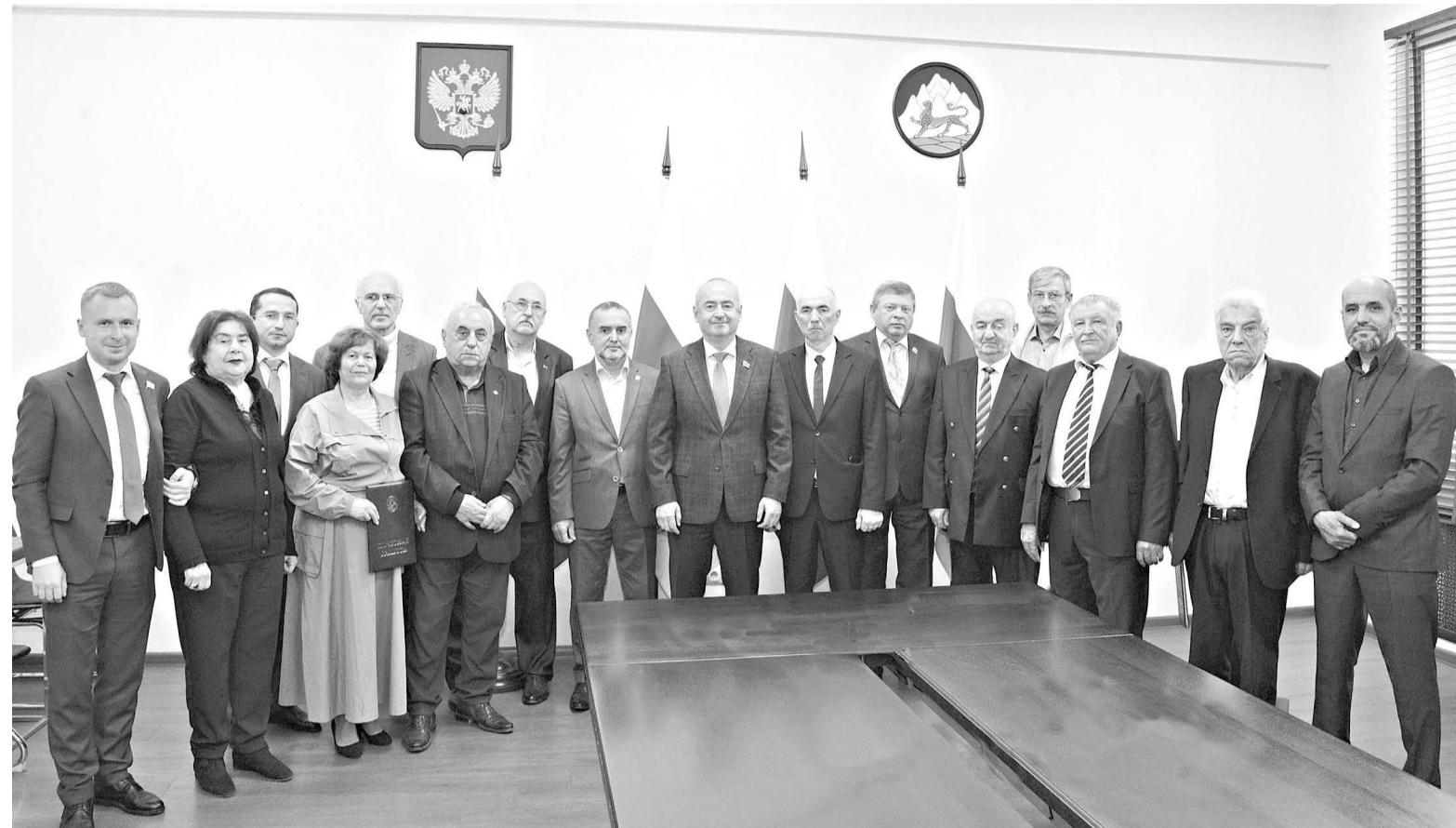
В канун празднования одного из главных государственных праздников России – Дня народного единства – Председатель Парламента РСО-А Таймураз ТУСКАЕВ встретился с представителями национального культурных обществ.