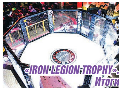
«IRON LEGION TROPHY» Итоги