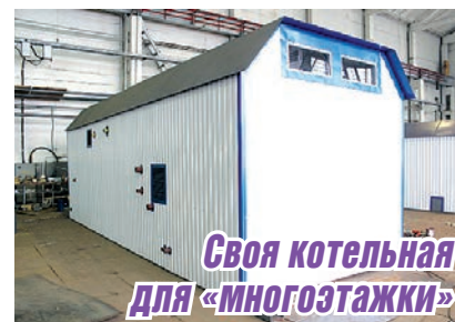
Своя котельная для «МНОГОЭТАЖКИ»