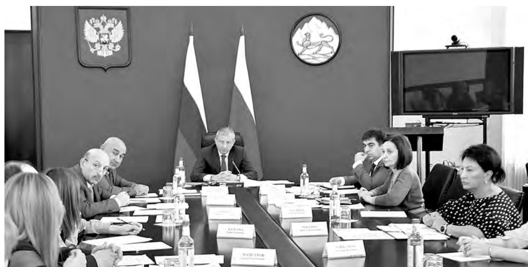
(Конец. Начало на 1-й стр.)

Медицинские организации способны качественно провести эту важную и актуальную работу – главное, чтобы была активность со стороны населения. Значит, нужны совместные действия органов исполнительной власти и местного самоуправления, общественных формирований с использованием существующих возможностей средств массовой информации, интернет-ресурсов, в том числе, и социальных сетей. — Следует внимательно изучить складывающуюся ситуацию и определить причины, которые мешают полностью охватить население диспан-