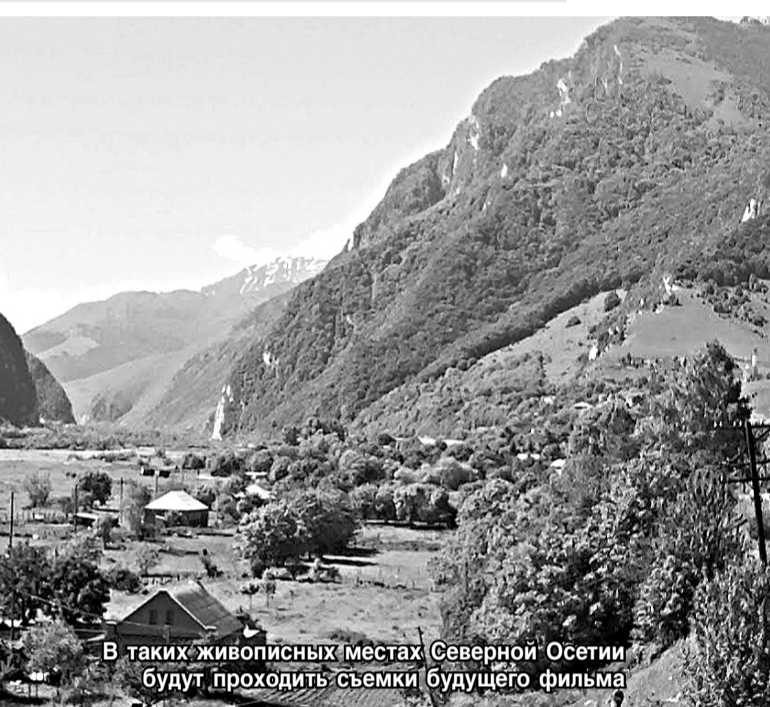
В таких живописных местах Северной Осетии будет проходить съемки будущего фильма