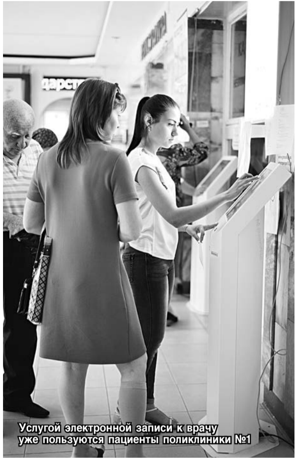
Услугой электронной записи к врачу уже пользуются пациенты поликлиники №1

– Вы сказали, что внедряется электронный документооборот. Внутри одной медицинской организации или между разными? – Это обмен документами, в том числе и юридическими, в электронном виде как внутри одной организации, так и между разными. Как пример – электронные рецепты и больничные. К сожалению, пока федеральная нормативная база регламентирует использование наряду с электронным и бумажный документооборот. При этом избежать дублирования работы можно, если специалист оформляет документ в системе и распечатывает из нее, но ни в коем случае не наоборот: пишет от руки и только потом вбивает данные в систему и распечатывает.