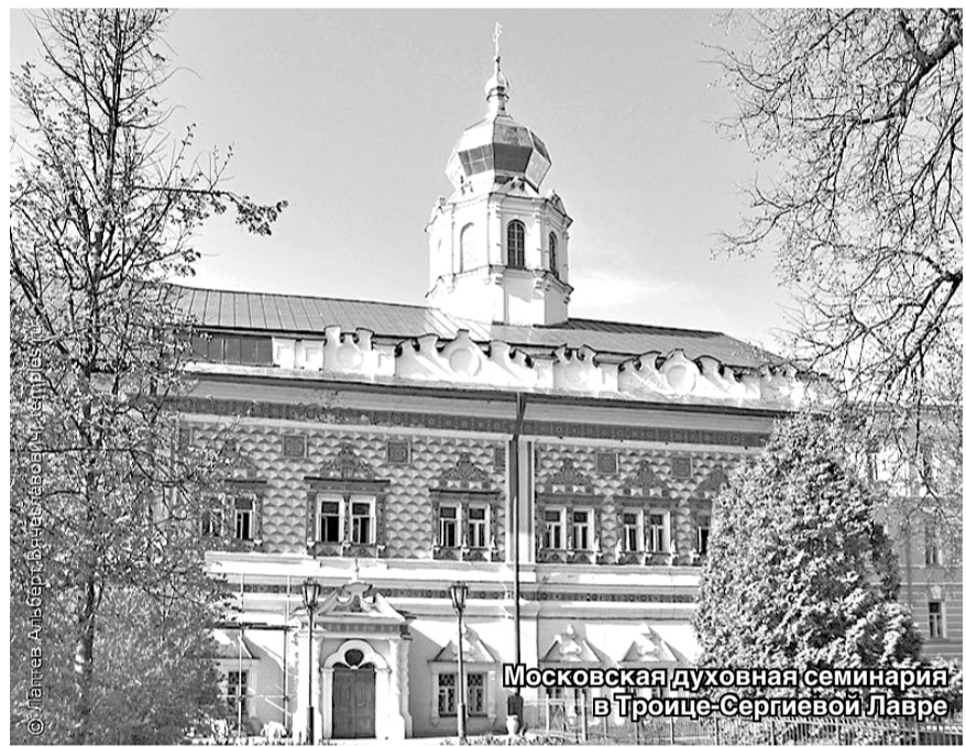
Московская духовная семинария в Троице-Сергиевой Лавре

мый императором Николаем I список претендентов на казенные вакансии Санкт-Петербургского университета. Однако студентом университета он так и не стал. Летом 1850 года был задержан на прусской границе и посажен под арест в г. Ковно (ныне г. Каунас Литовской Респблики). На допросе Цораев дал показания, что «к прусской границе он прибыл без всякого злого намерения, единственно из одного любопытства – иметь понятие о таможенном порядке». Истинная причина его незаконного отъезда из Санкт-Петербурга так и осталась неизвестна.