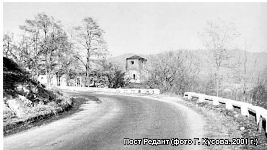
Пост Редант