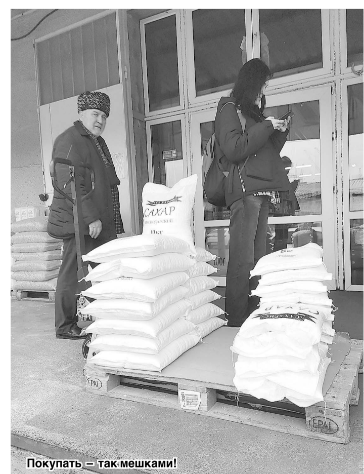
Покупать — так мешками!

«Не удивлюсь, если кто-то из производителей специально может попридержать свою продукцию, чтобы в дальнейшем продать ее с большей выгодой. Как говорится, спрос рождает предложение, а спрос сейчас — ажиотажный и спекулятивный», — поделился торговец одного из мелкооптовых магазинов складов рынка. — Мы звоним на базы, там говорят, поставка сырья под вопросом. Эта неопределенность передается покупателям, которые считают, что сегодня-завтра наступит тотальный дефицит товаров первой необходимости. Хотя более 90% этой продукции — наши, отечественные. Нехватки в них быть не может».