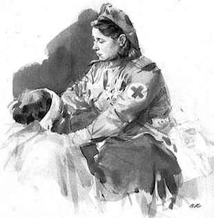
«За отвагу» на груди.

Родилась в с. Майрамадаг Алагирского района. Младший лейтенант медицинской службы. На фронте была с первых дней в составе отдельной противотанковой истребительной дивизии 6-й армии 1-го Украинского фронта.