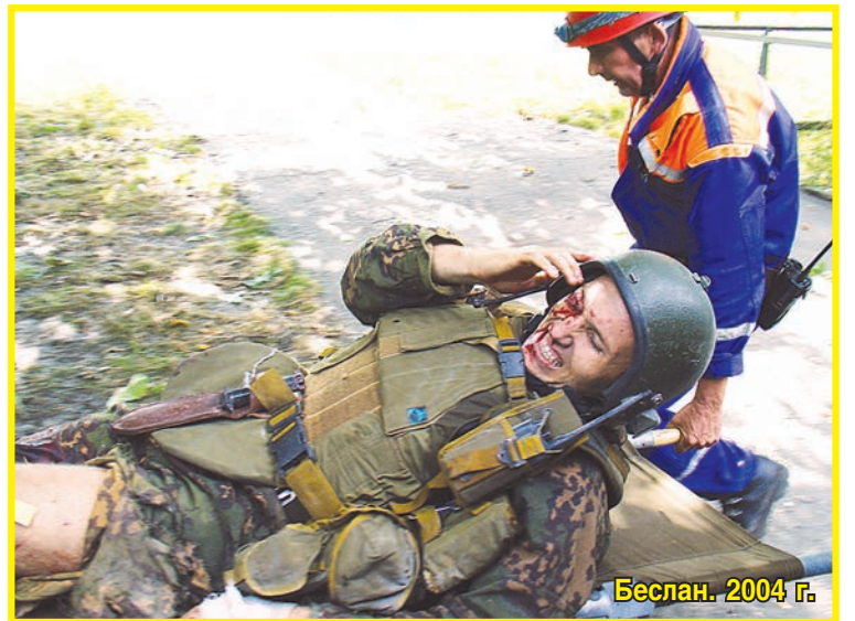
Беслан. 2004 г.

ной по своим масштабам гуманитарной операции, проведенной МЧС России.