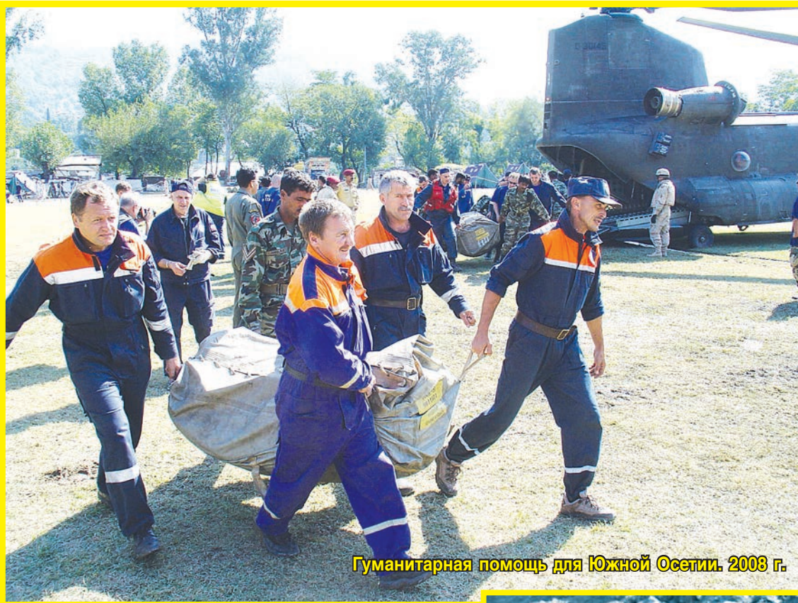
Гуманитарная помощь для Южной Осетии. 2008 г.

Трудились сотрудники МЧС и над обустройством пунктов временного размещения населения, участвовали в подготовке школ и детских садов Цхинвала к новому учебному году.