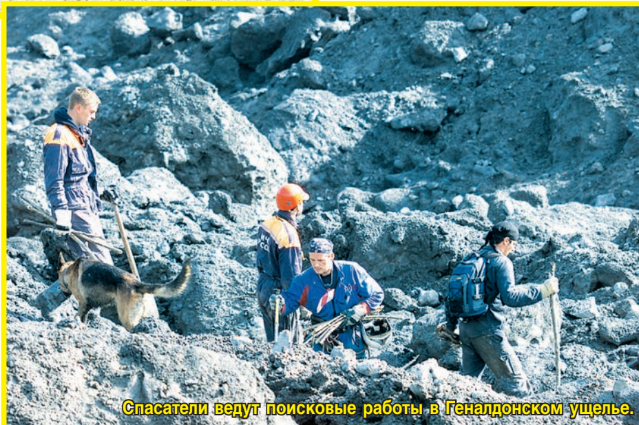
Спасатели ведут поисковые работы в Геналдонском ущелье.

Сложным для чрезвычайного ведомства Север-