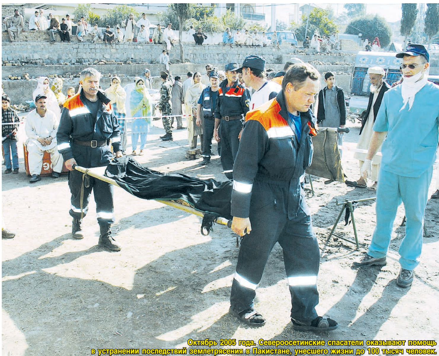
Октябрь 2005 года. Североосетинские спасатели оказывают помощь в устранении последствий землетрясения в Пакистане, унесшего жизни до 100 тысяч человек.

28 ИЮЛЯ ИСПОЛНЯЕТСЯ 25 ЛЕТ СЕВЕРО-ОСЕТИНСКОМУ ПОИСКОВО-СПАСАТЕЛЬНОМУ ОТРЯДУ МЧС РОССИИ