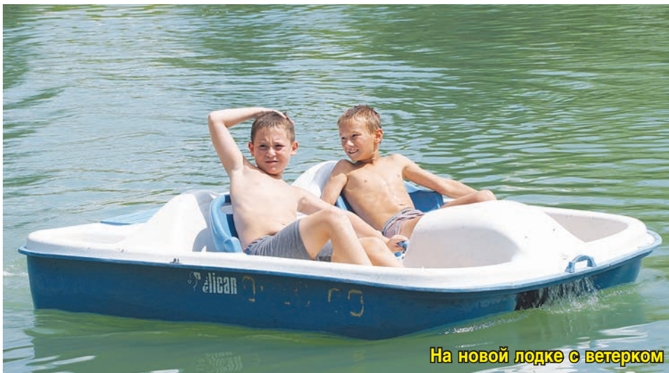
На новой лодке с ветерком

Палящее солнце вынуждает искать спасение от жары. И хотя в начале июля «СО» писала о том, что купаться на Владикавказской водной станции нельзя, запрет не стал помехой для горожан. В будний день мы с фотокорреспондентом застали там пару сотен отдыхающих. Детский пляж переполнен, с дамбы с разбега ныряют в прохладную воду подростки. А на берегу установлены торговые лотки с мороженым, напитками, спасательными жилетами и кругами. Желающие могут покататься на катамаране.