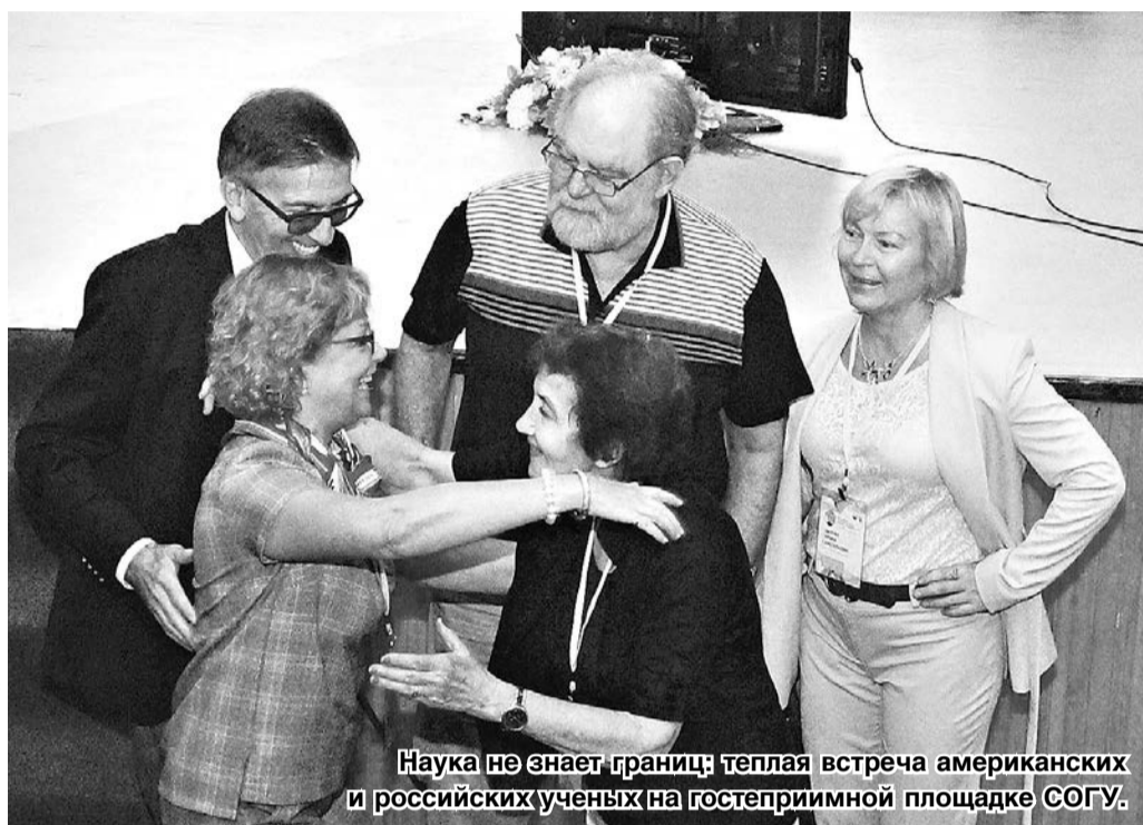
Наука не знает границ: теплая встреча американских и российских ученых на гостеприимной площадке СОГУ.