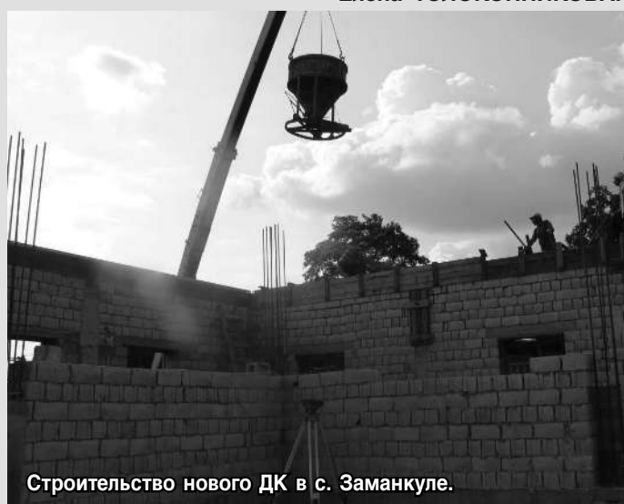
Строительство нового ДК в с. Заманкуле.