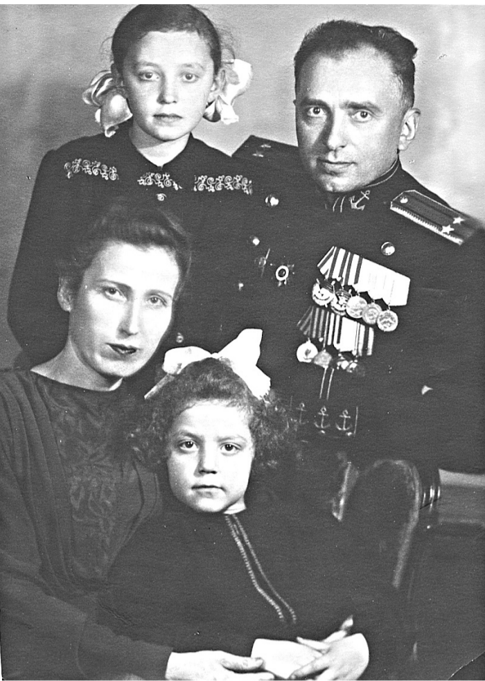
Папа отбыл на фронт, получив временный диплом о прослушивании 1-го курса академии, а мама с маленькой дочуркой на руках вернулась в Осетию...

1941 год. Вся огромная страна в едином порыве встала на «смертный бой» с фашистской силой чернуло, с проклятой ордой».