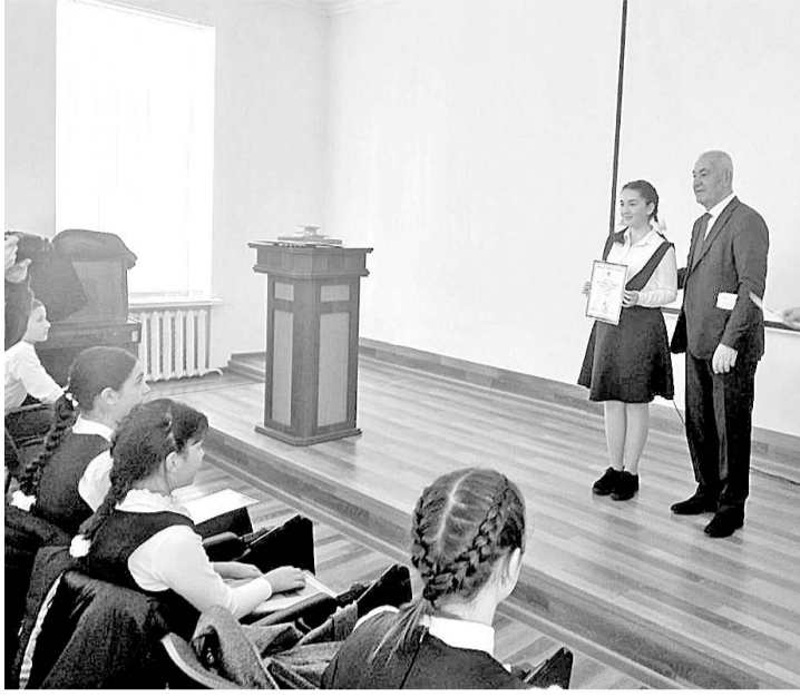
Заслуженные награды и благодарности за свою плодотворную работу получили их наставники-учителя.

Во Владикавказе состоялось торжественное мероприятие, посвященное чествованию победителей конкурса рисунков «Слово и образ». Организатором этого знакового события уже третий год подряд является Национальный научно-культурный центр имени Коста Хетагурова. В этом году конкурс был посвящен творческой интерпретации произведения «Сидзаргас» кисти выдающегося мастера. Он привлек внимание более 50 талантливых школьников с первого по одиннадцатый классы из всех районов республики.