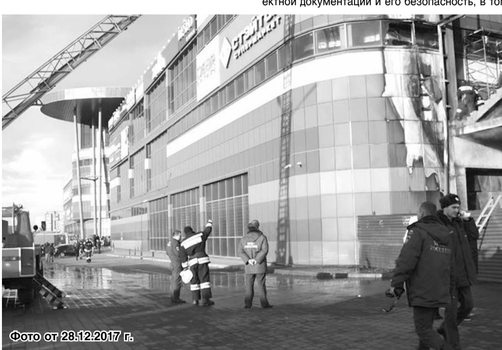
Фото от 28.12.2017 г.

После получения разрешения на строительство соответствие работ проекту контролирует служба архитектурно-строительного надзора. После сдачи здания пожарную безопасность инспектируют специалисты МЧС. Но на объектах малого и среднего бизнеса плановые проверки могут проводиться не чаще одного раза в три года. Внеплановая проверка — по согласованию с прокуратурой. Что касается строительных материалов, то все они в той или иной степени горят, хотя классифицируются по этому признаку. Для облицовки фасада используют разные утеплители, и чем они дешевле, тем хуже по качеству. Для