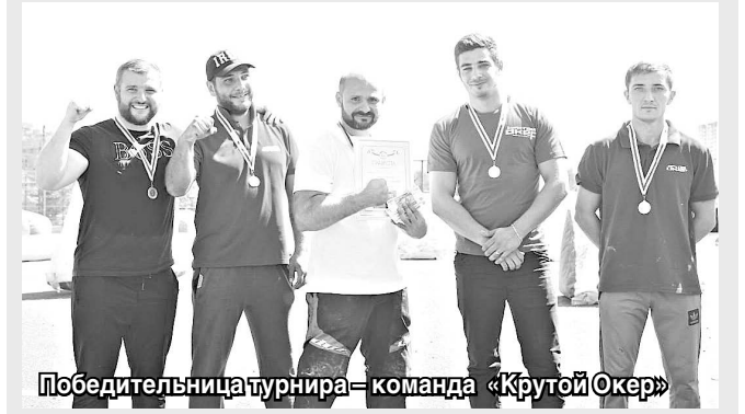
Победительница турнира – команда «Крутой Океан»

Во Владикавказе состоялся открытый турнир по пейнтболу на призы клуба «Легион 15».