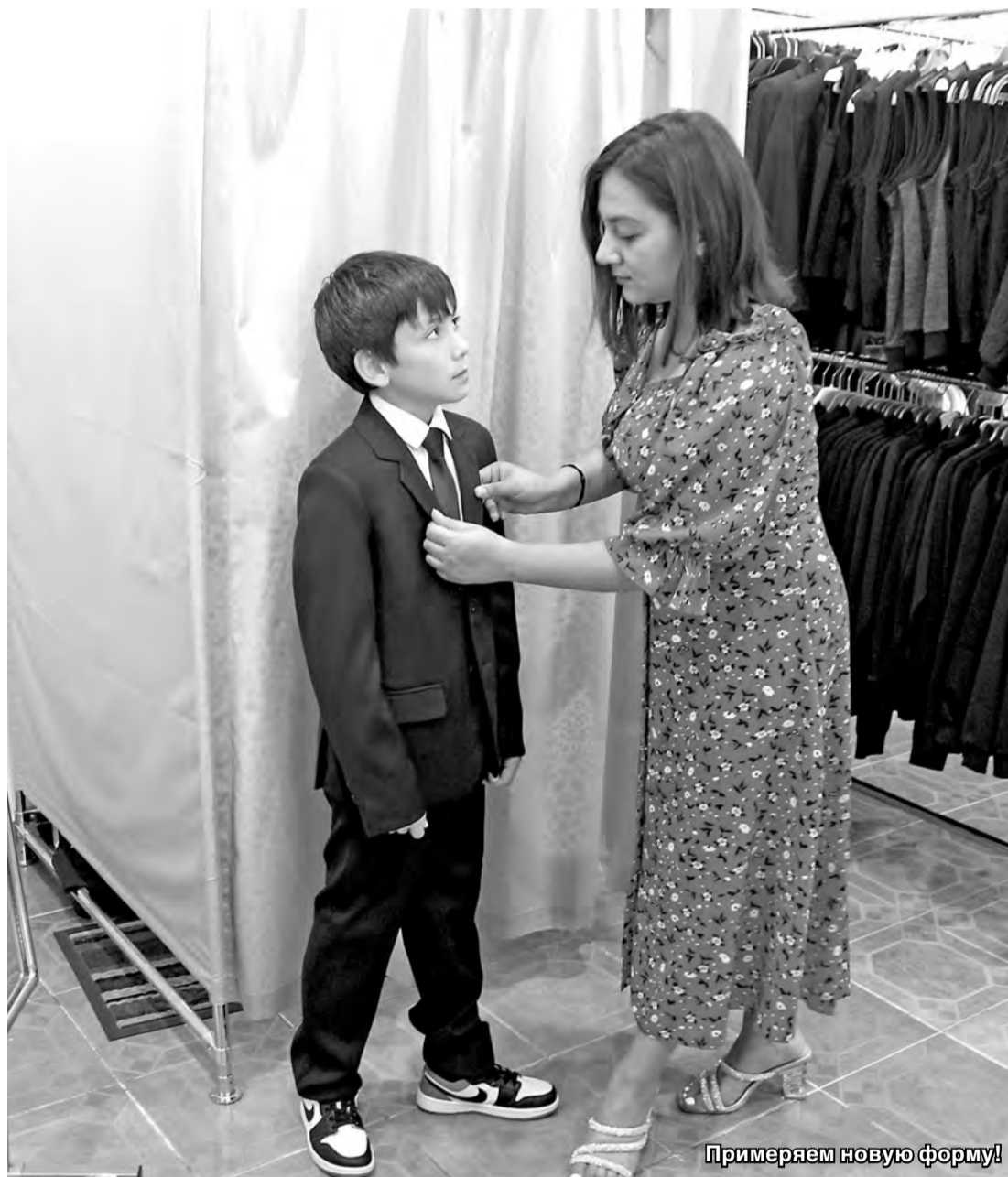
Примеряем новую форму!

– Конечно, тревожно на душе. Мы откладывали деньги к началу учебного года и кое-что уже купили. В 40-градусную жару не очень походишь по торговым точкам, выручают интернет-магазины. Но одежду все-таки лучше примерить на ребенка (он же в ней почти весь день будет!), вот и ходим. Нам в городской школе №1, куда мы пойдем учиться, сказали, что форма должна быть темно-синего цвета. Вот купили пока каждому по белой рубашечке по полторы тысячи, брючки за 1200 рублей. Так как у мальчиков плоскостопие, покупаем всегда специальную обувь, а она дорогая, не меньше 2 тысяч рублей за пару. Брюк одной пары и по одной рубашке недостаточно, я уже знаю: мальчишки же! Придется каждому по две пары на сменку брать. Еще нужны спортивные обувь и форма, на них тоже уходит не менее 2 тысяч рублей на каждого