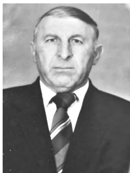
которые всеми правдами и неправдами пытаются игнорировать этот предмет. Особенно малыши в нем души не чаяли. У папы много наград и грамот. Он – отличник народного просвещения Российской Федерации. А мама – заслуженный учитель Северной Осетии. Но главным