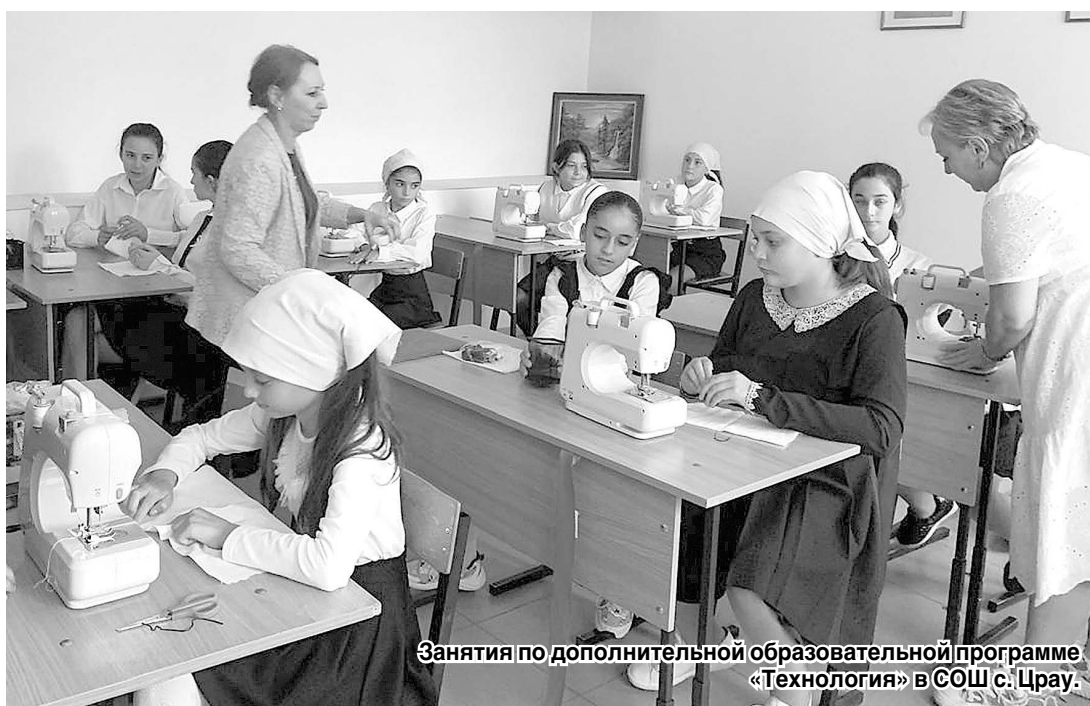
Занятия по дополнительной образовательной программе «Технология» в СОШ с. Црау.

Федеральный проект «Успех каждого ребенка» направлен на создание и работу системы выявления, поддержку и развитие способностей и талантов детей и молодежи. В рамках проекта в республике ведется работа по обеспечению равного доступа детей к актуальным и востребованным программам дополнительного образования, а также профориентация обучающихся.