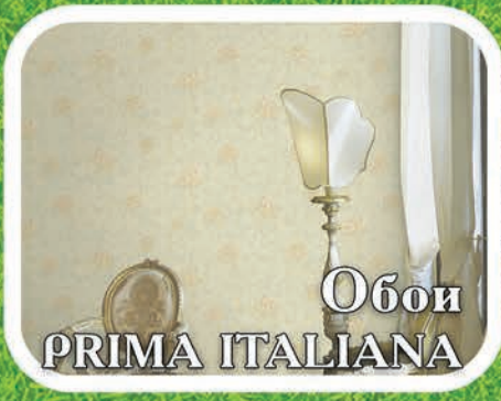
Обои PRIMA ITALIANA