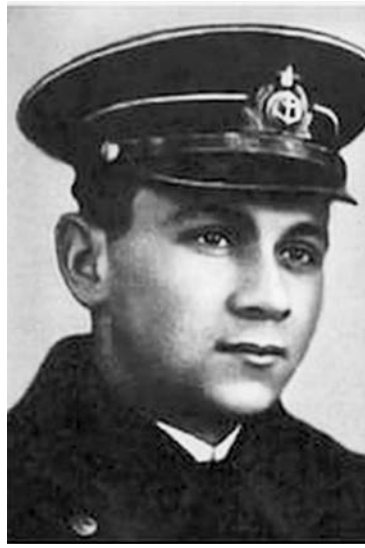
ленных к высшему званию СССР.