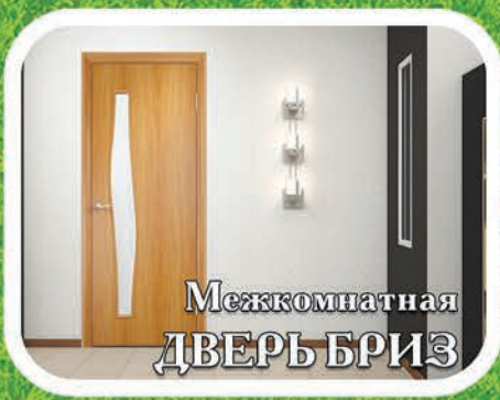
Межкомнатная ДВЕРЬ БРИЗ