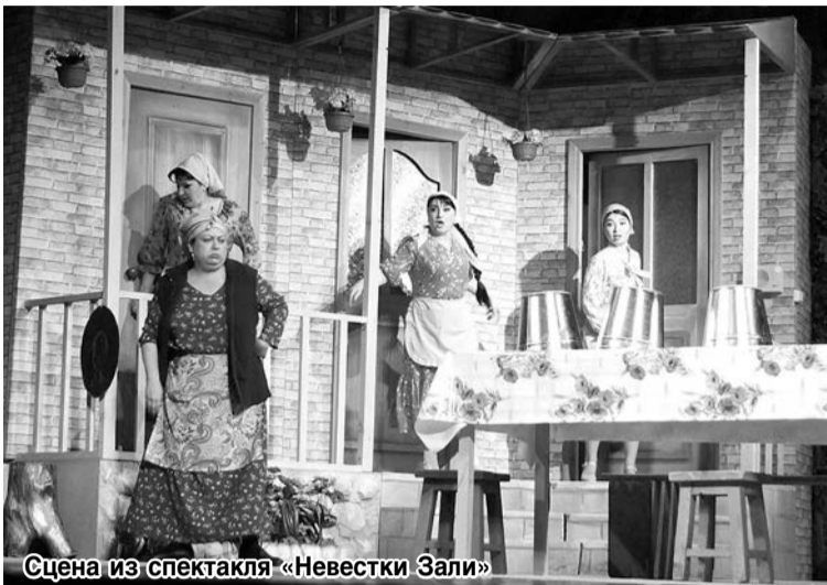
Сцена из спектакля «Невестки Зали»

мая включительно на сцене Азербайджанского государственного ТЮЗа, который 2-4 мая, в свою очередь, побывал в гостях у Осетинского театра во Владикавказе со сказкой «Тук-Тук Ханум».