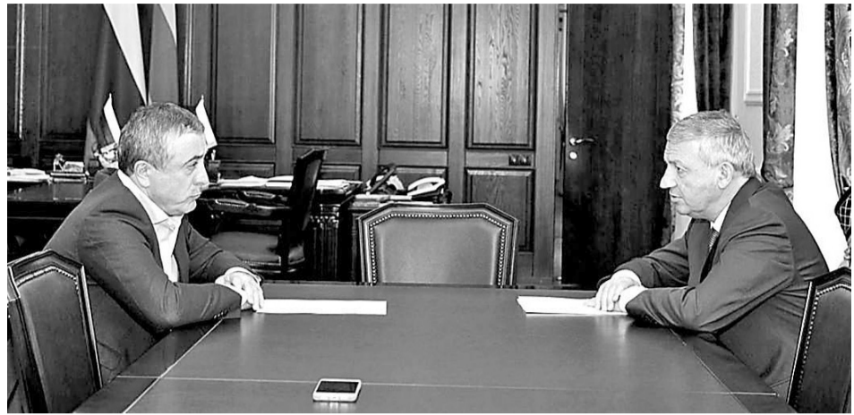
Глава Республики Северная Осетия – Алания Вячеслав БИТАРОВ встретился с членом Совета Федерации Федерального собрания Российской Федерации Арсеном ФЕДОТКИНЫМ.

В ходе встречи обсуждались вопросы социально-экономического развития республики, требующие рассмотрения в высшем законодательном органе страны. В ближайшем будущем, как сообщил Вячеслав Битаров, правительством республики будет завершена работа по подготовке документации для участия в мероприятиях федеральных целевых программ, и выразил надежду, что на парламентском часе проекты будут достойно представлены и получат одобрение сенаторов.