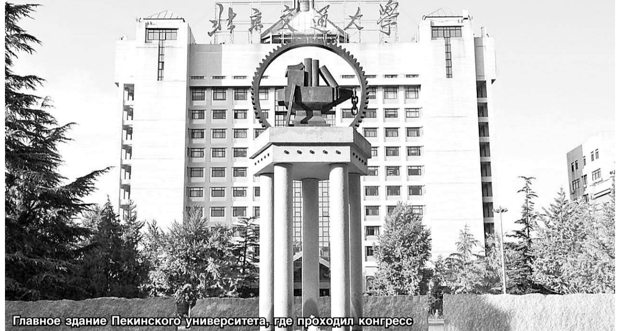
Главное здание Пекинского университета, где проходил конгресс

В отличие от России, в Китае 200-летний юбилей Маркса отмечали и на самом высоком государственном уровне. 4 мая в Доме народных собраний в Пекине по этому поводу состоялось торжественное собрание, на котором присутствовали высшие руководители страны. С важной речью выступил Генеральный секретарь ЦК КПК, Председатель КНР Си Цзиньпин. «Прошло двести лет, и несмотря на огромные и глубокие изменения в обществе, имя Карла Маркса пользуется уважением во всем мире, а его теория по-прежнему блистает подобно бриллианту светом истины», – заявил китайский лидер. Он отметил, что, как и память Карла Маркса, китайцы выражают почтение величайшему мыслителю в истории человечества и декларируют твердые убеждения в марксизме. Он неизменно является руководящей идеей партии и государства, мощным идейным оружием для познания мира, усвоения закономерностей, стремления к истине и преобразования мира. «В новую эпоху, – подчеркнул глава страны, – китайским коммунистам следует, как и раньше, учиться у Карла Маркса, изучать марксизм