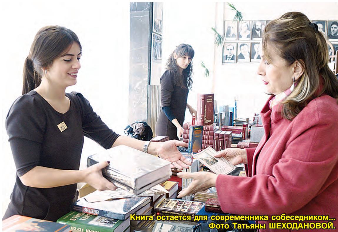
Книга остается для современника собеседником...