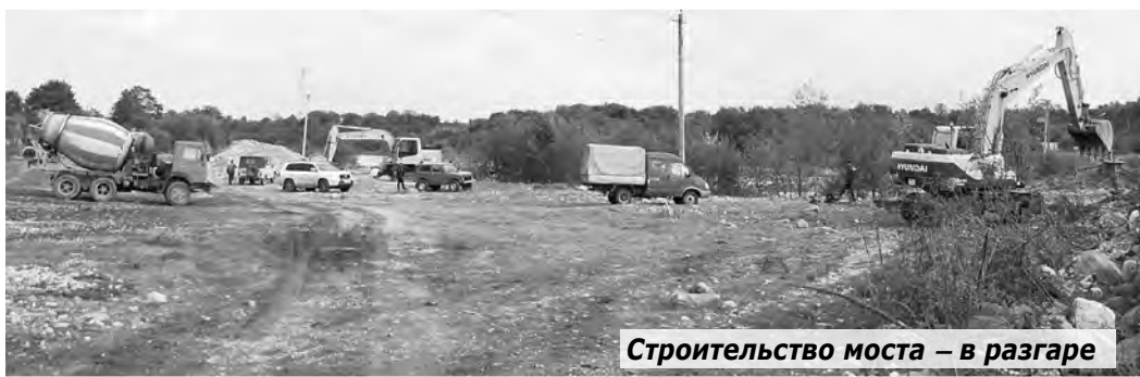
Строительство моста – в разгаре