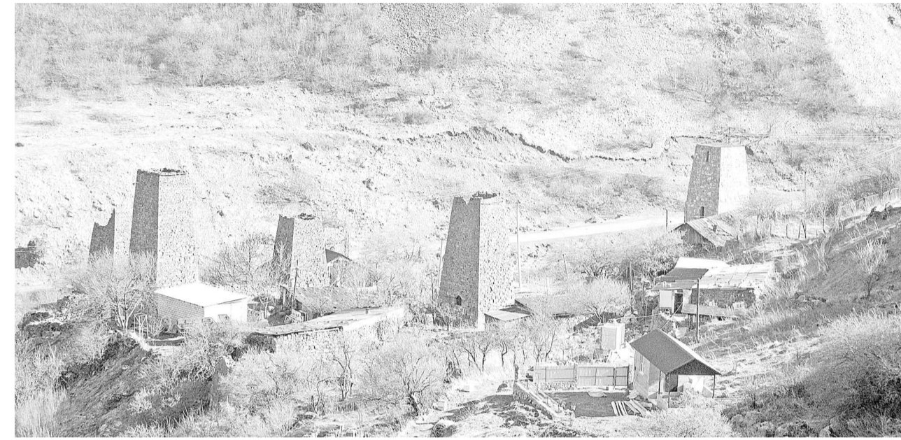
всех объектов культурного наследия в нашей республике. Их очень много. Нужна помощь общества. Реализация проекта «Память сквозь века» позволит поделиться реальным прак-

– Решение участвовать в конкурсе мы приняли нашей фамильной организацией. С целью сохранить для будущих поколений культурное наследие наших предков, постараться привести боевую башню фамилии в первоначальный вид. Таким образом мы прививаем нашим младшим любовь к родному краю, привлекаем их к участию в общественно-полезном труде, воспитываем в них чувства патриотизма и гордости за свою фамилию, нацию, большую Родину. Проект направлен на популяризацию бережного отношения к объектам культурного наследия среди молодежи на территории РСО-А через личное участие в процессе восстановления, реконструкции части кон-