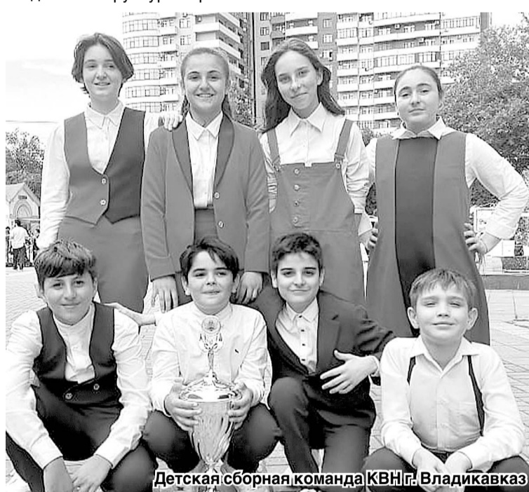
Детская сборная команда КВН. Владикавказ

Если в 2019-м Республиканский театр КВН провел 27 мероприятий, включая выездные игры, то в 2020-м их было не больше десяти, и то с учетом онлайн-формата. Но творческая группа и сами участники не отдыхали: они работали над новой структурой организа-