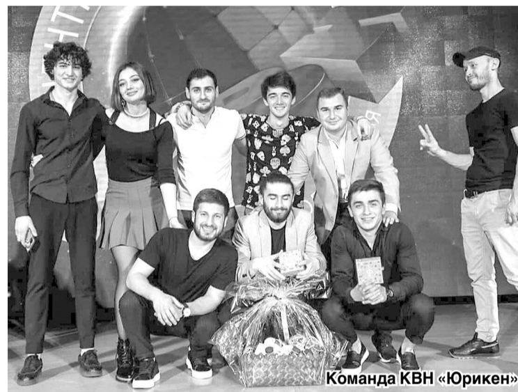
Команда КВН «Юрикен»

– Тематика все более разнообразная, шутки все более тонкие, часто близкие к сатире, да и уровень актерской игры ребят заметно растет. Ставит ли перед собой КВН какие-то новые задачи в развитии молодежной политики или он просто продолжает собирать в свои ряды талантливую молодежь по обе стороны сцены?