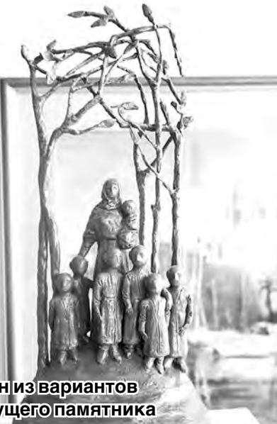
Один из вариантов будущего памятника

Фонд Задалески Нана, зарегистрированный в мае 2015 года, считает вопрос увековечения ее образа очень своевременным и актуальным. Несмотря на свою богатейшую историю и мифологию, Осетия до сих пор не имеет материализованного символа республики, близкого по выразительности к таким памятникам, как Давид Сасунский, Салават Юлаев, Мать-Грузия. Женщина, взявшая на себя роль спасительницы народа, – это обстоятельство поднимает значимость образа Задалески Нана на высоту всенародного символа. Образ Родины всегда ассоциировался с матерью. Статуи в образе женщины-Родины установлены во многих странах. Но это собирательные образы, в то время как Задалески Нана является реально существовавшей исторической личностью.