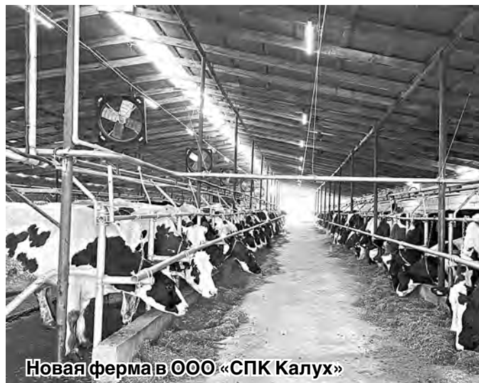
Новая ферма в ООО «СПК Калух»