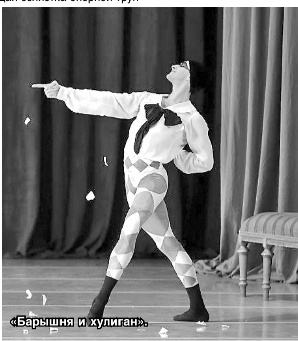
«Барышня и хулиган».

Ни единого билета не осталось в кассах филиала Мариинского театра и на балетные спектакли, которыми 28 и 29 сентября завершится фестиваль.