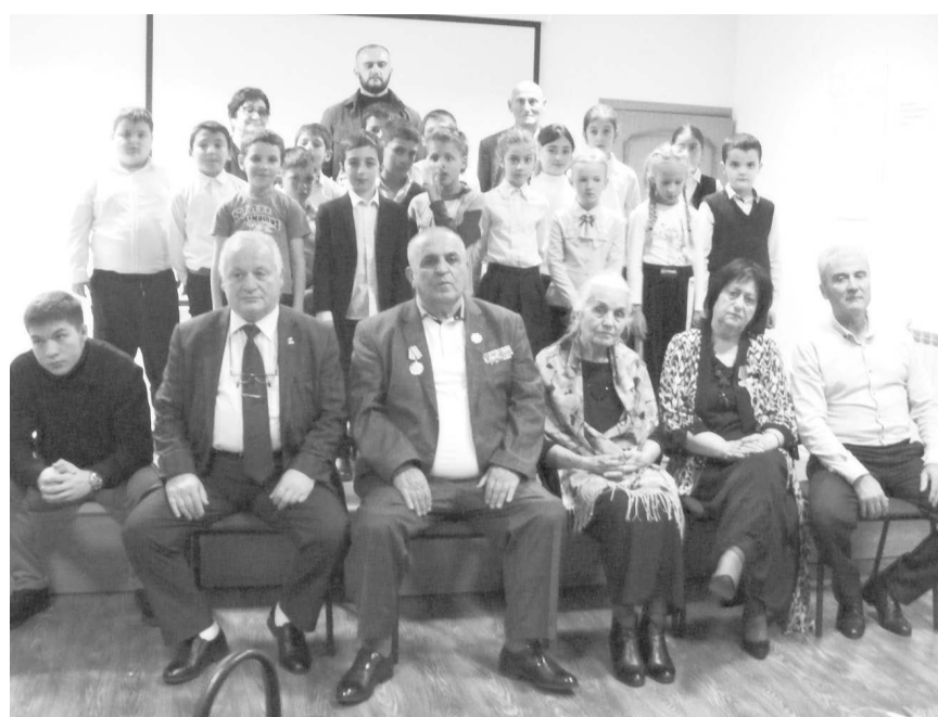
«СО» не раз сообщала о встречах поколений, организуемых по инициативе руководства Совета ветеранов г. Владикавказ...