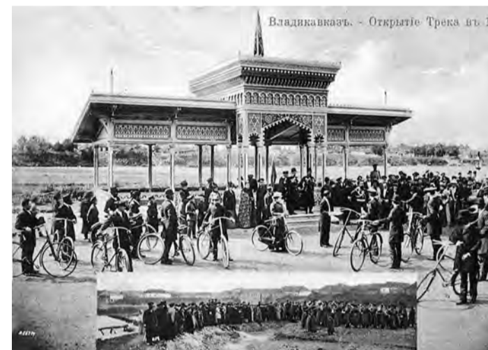
Владикавказ. — Окрестки Терека в 1873

В середине 1960-х годов я был членом сборной Северной Осетии по велоспорту. Как-то ко мне подошел пожилой человек, который поведал, что в молодости занимался велоспортом на велотреке в центральном парке. Этот велотрек просуществовал до Великой Отечественной войны. Но во время одной из бомбежек значительная его часть была уничтожена, а после войны ее так и не восстановили. А старожилы города наш центральный парк продолжали называть «Трек».