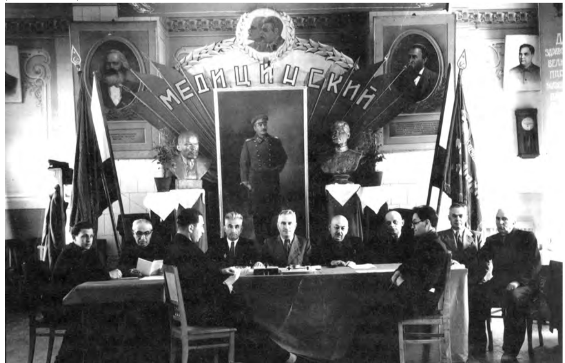
Идет государственный экзамен. 1943 г.

Борьба за высшую медицинскую школу в Северной Осетии на этом не закончилась.