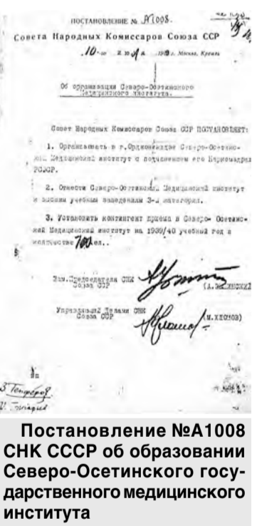
Постановление №А1008 СНК СССР об образовании Северо-Осетинского государственного медицинского института

Периодически по разным причинам Минздрав РСФСР подни-