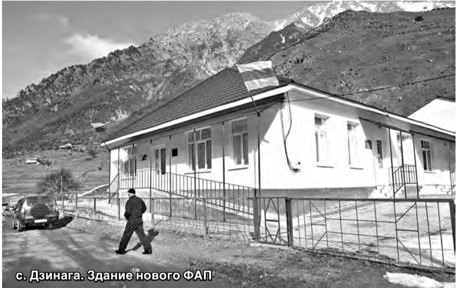
с. Дзинага. Здание нового ФАП

Последний сход с участием федеральных и муниципальных служб в Ирафском районе республики, состоявшийся неделю назад, обнажил ряд насущных проблем, волнующих сегодня граждан. Звучали на нем вопросы трудоустройства, а также — медицины и здравоохранения, поднялись проблемы водоснабжения и качества дорог. Но самым острым остается все же земельный. И именно с сигнала, поступившего в ходе диалога граждан с властью, началось очередное разбирательство в районе по незаконно переданным в частную собственность земельным участкам и объектам.