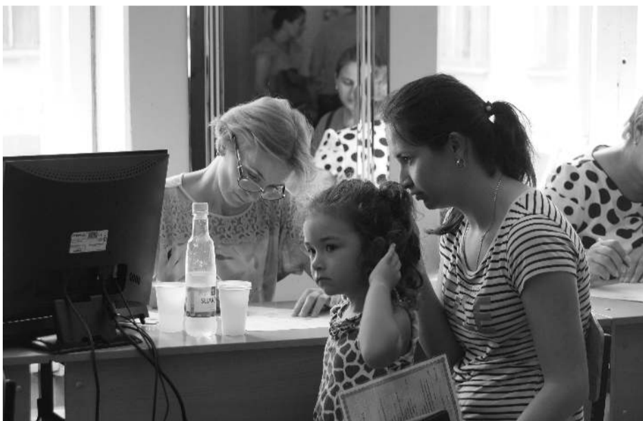
в школу рядом с домом.

— До 21 августа. Да, еще две недели. Но каждый день у нас четко расписан: в понедельник в 28-й школе записывали детшек в садик Иристонского округа. В среду работали в 44-й школе, здесь принимали малышей Затеречного округа. 10 августа на базе 15-й школы будем принимать родителей из Промышленного. И самый большой округ — Северо-Западный, в 46-й школе будем рассматривать заявления с 14 по 16 августа. Распределили свои силы, исходя из шаговой доступности для родителей, чтобы им было удобно занести документы