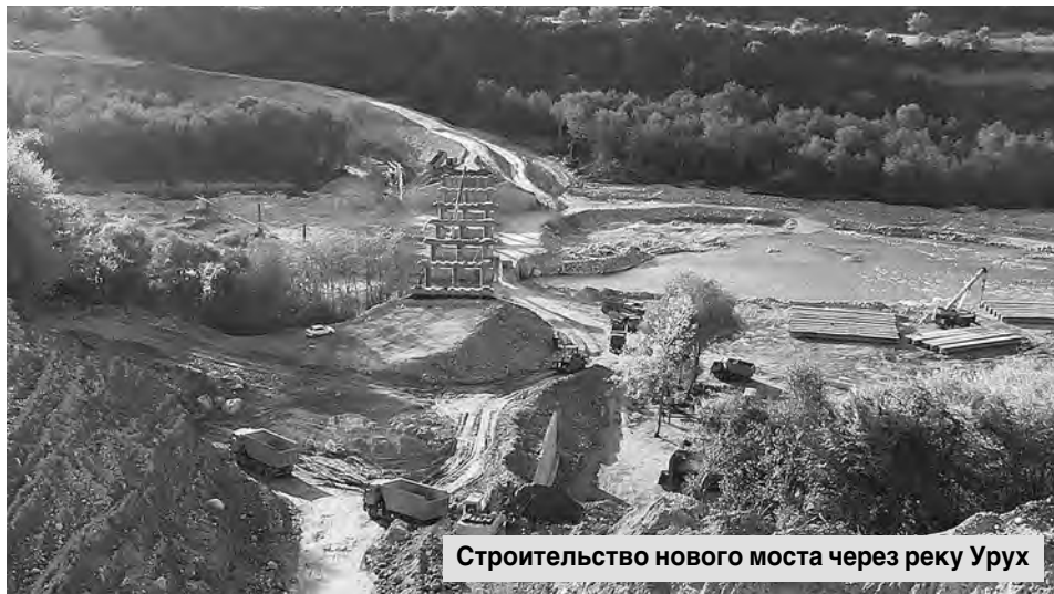
Строительство нового моста через реку Урух

Километры автодорог общего пользования: трассы, по которым ежедневно проносятся десятки тысяч машин, и извилистые горные дороги, обеспечивающие связь между самыми отдаленными районами. А еще – площади, проспекты, улицы больших городов и скромные переулки маленьких населенных пунктов.