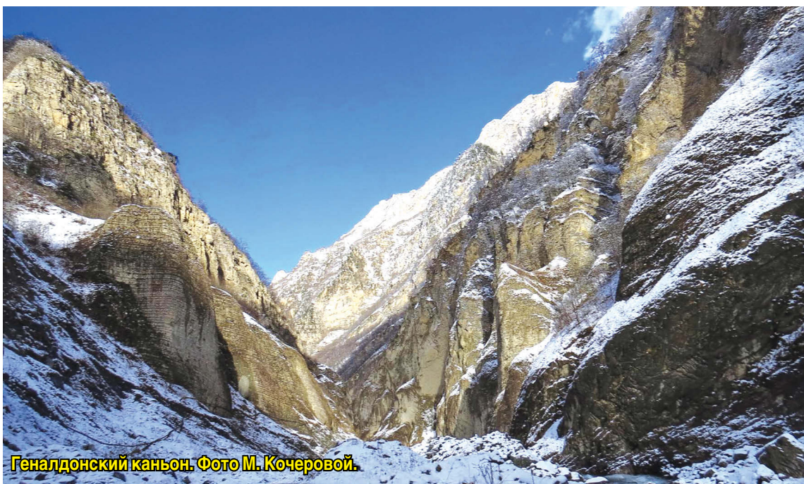
Геналдонский каньон.

Кобанский каньон. Узкая извилистая теснина, размытая р. Гизельдон в Скалистом хребте, длиной более 3-х км, которая тянется за с. Кобан до Пуртского завала. Известняковые, иногда обнаженные склоны каньона поднимаются над его дном до высоты 800–1000 м. Ширина каньона на