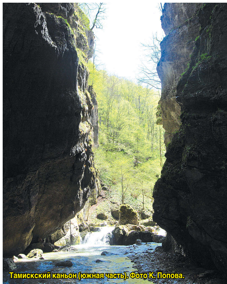
Тамисский каньон (южная часть).

Каньоны (Ворота природы) привлекали внимание художников и фотографов. Фото Кармадонских ворот есть в многочисленных краеведческих изданиях, на открытках. Многие каньоны манят неземными видами. Порой они ждут нужного освещения, чтобы сделать снимок, когда это творение природы предстанет во всем великолепии. Другие при созерцании каньонов впадают в медитативно-философские размышления... Они являются символами ущелий и ключевыми образами нашего края.