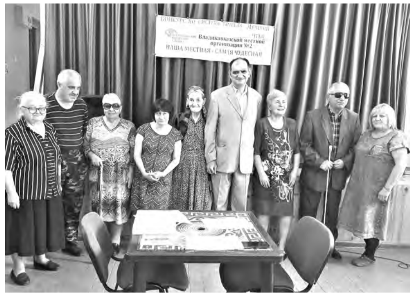
Луи Брайль создал алфавит, который сделал реальной вековую мечту незрячих людей о грамотности. Сотни тысяч человек, лишенных зрения, благодаря рельефно-точечному шрифту научились читать, писать, открыли для себя возможность полноценной социальной жизни.

Самостоятельное общение с книгой является важным этапом реабилитации слепых и слабовидящих. Чтение по Брайлю развивает ум, память, воображение, навыки грамотного письма, способствует расширению активного словарного запаса. На днях Республиканской библиотекой для слепых и Всероссийским обществом слепых был проведен конкурс на лучшего чтеца по системе Л. Брайля. Данное мероприятие имеет давнюю традицию и проводится ежегодно. Сначала проходит отборочный этап, а затем республиканский. По итогам конкурса выявляются победители и номинанты. Всероссийское общество слепых награждает их грамотами и, по возможности, денежными призами. Этим летом библиотека проводила и другие интересные мероприятия. В июне она принимала гостей из Республиканского центра реабилитации детей-инвалидов «Феникс». Работники библиотеки были подготовлены познавательной-развлекательная программа, куда вошли экскурсия по библиотеке, знакомство с книжными выставками, исторические справки,