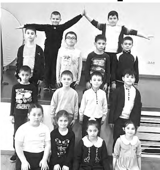
Репетиция у первых классов в театральной студии Аланской гимназии

Театральный кружок в гимназии появился еще до реализации общефедерального проекта – в 2017 году, и за пять лет успел приобрести официальный статус театральной труппы с обязательным выпуском спектакля в конце года. И уже на