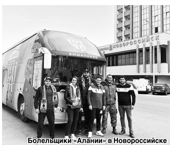
Болельщики «Алании» в Новороссийске

«Черноморец» (Новороссийск) – «Алания-Владикавказ» – 0:1 (0:0) 16 ноября, Новороссийск. Стадион «Центральный», 1500 зрителей. Главный судья – Роман Сафьян (Москва). «Черноморец»: Зайцев, Черов, Ахмеджанов, Поникаров, Джамалутдинов, Гаранжа (Пацев, 74), Шабичев (Захаров, 68), Чабанов (Мироник, 88), З. Магомедов (Ваганов, 90), Дибиргаджиев, Матюшенко (Волков, 68). «Алания-Владикавказ»: Солдатенко, Кочиев (Цакоев, 68), Бутаев, Засеев, Шавлохов, Хабалов (Гурчиев, 60), Хадарцев, Б. Магомедов, Хугаев (Цараев, 60), Черчесов (Дж. Кобесов, 54), Машуков (Крамаренко, 73). Гол: Шавлохов, 80. Предупреждения: Дибиргаджиев, 14; Джамалутдинов, 62; Хабалов, 80; Захаров, 90+.