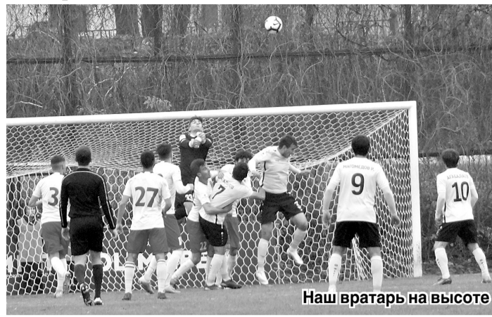
Наш вратарь на высоте