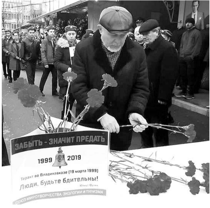
Акция юных миротворцев «Забыть — значит предать!» собралась в этот день на том самом месте, где сработало самодельное взрывное устройство, которое преступники заложили в мешок с овощами, десятик неравнодушных людей. Среди них — учащиеся школ, а также те, кто в тот злополучный день оказался

Вчера во Владикавказе юные миротворцы стран СНГ в РСО-А провели мероприятие, посвященное памяти погибших на Центральном рынке в результате теракта 19 марта 1999 года. В нем также приняли участие представители Совета ветеранов РСО-А, сотрудники Республиканского дома дружбы, родственники погибших в террористическом акте, учащиеся школ и других учебных заведений.