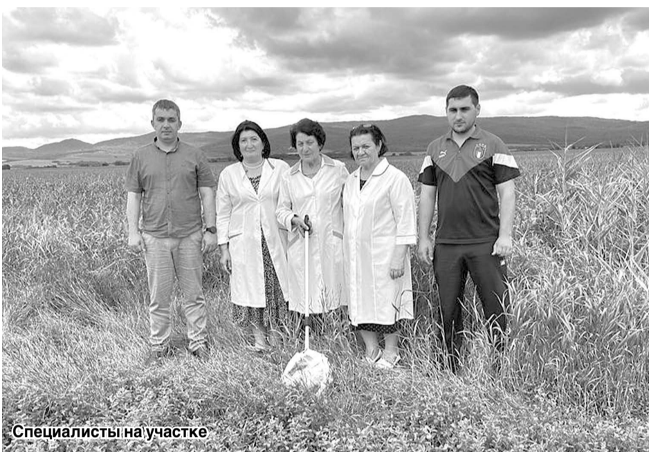
Специалисты на участке

Для выявления очагов вредителя и недопущения повреждений сельскохозяйственных культур специалистами постоянно проводится разъяснительная работа среди земледельцев и населения о возможном появлении саранчи, о необходимости немедленного принятия мер по ее локализации и оповещения специалистов и администраций муниципальных образований района. Хозяйствам всех форм собственности предоставляются рекомендации по мерам борьбы против саранчовых вредителей.