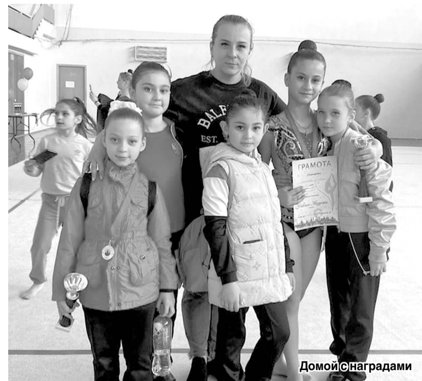
Домой с наградами