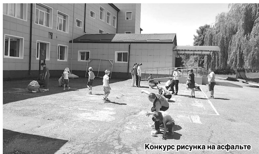
Конкурс рисунка на асфальте

В Карджинской СОШ имени Героя Советского Союза Б. Моргоева пришкольный спортивно-оздоровительный лагерь дневного пребывания для учащихся начальных классов функционирует каждое лето.