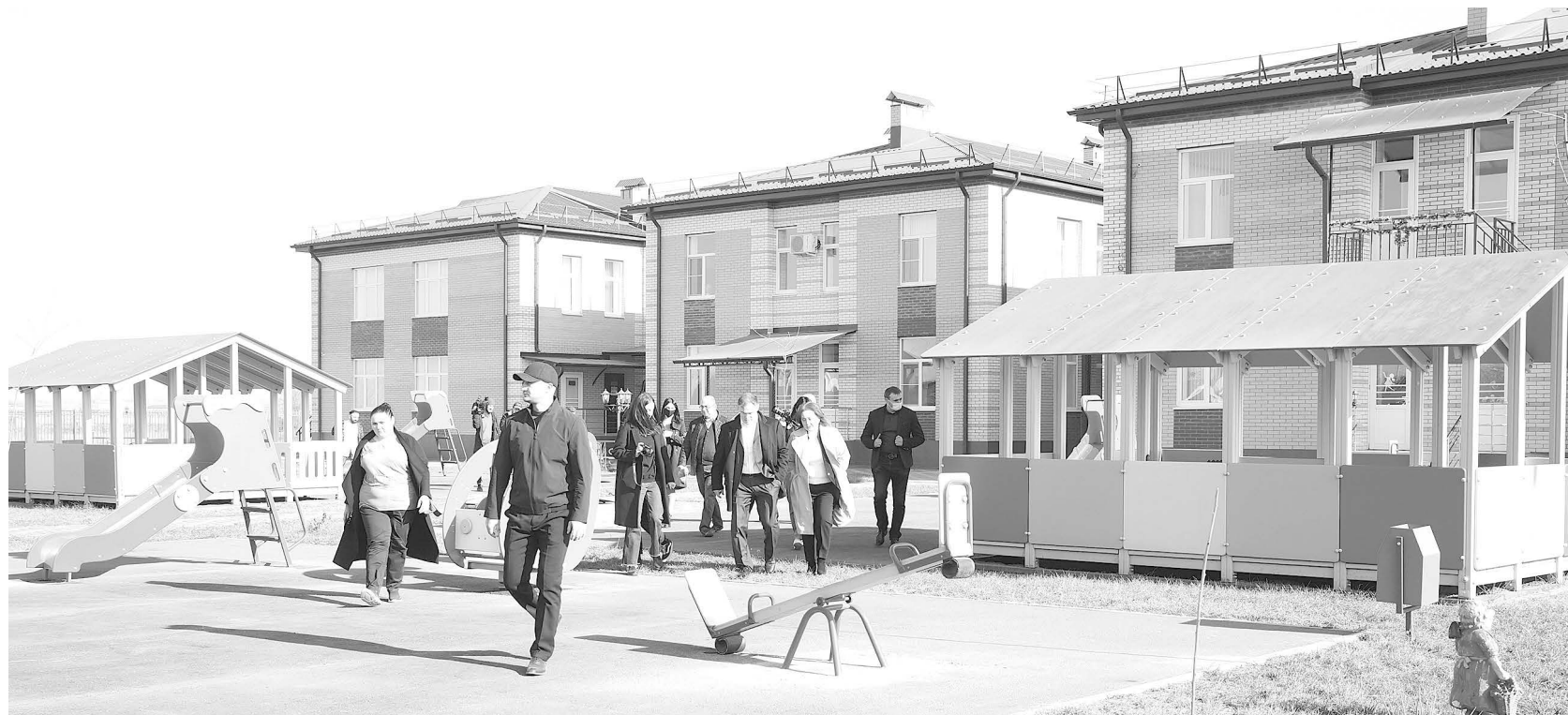
(Окончание. Начало на 1-й стр.)