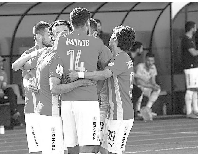
Скоростную комбинацию, венцом которой стал точный удар другого защитника вратарю...