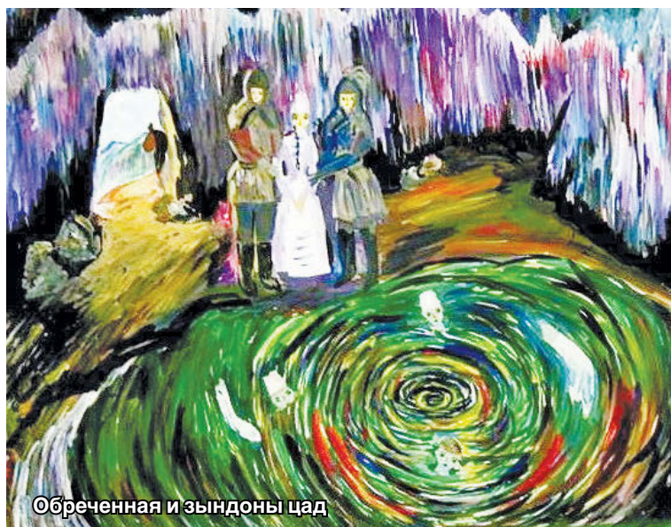
Обреченная и зындоны цад

Вот и Шатана знала, что ей грозит опасность: заговорщики заранее договариваются о дате, когда осуществят задуманное. Она сначала безуспешно пытается послать вестников к Сослану. Удастся ей передать весточку только с третьего раза. Это можно считать нарративным приемом подготовки слушателя,