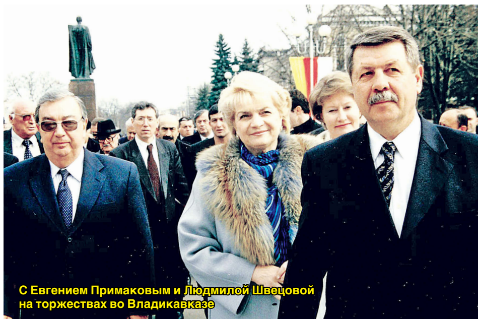
С Евгением Примаковым и Людмилой Швецовою на торжествах во Владикавказе