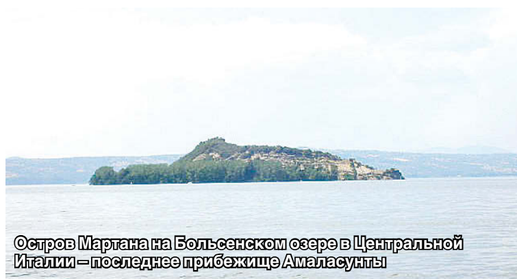
Остров Мартана на Большесенском озере в Центральной Италии — последнее прибежище Амаласунты

подхода становится значимой информация, которая с обоснованной настойчивостью проводится в тексте кадагов: хурискæсæн (восток). Именно на восток уехал Сослан в длительный балц (поход). В нескольких вариантах кадага три раза посылает Шатана птиц-вестников и каждый раз на восток.