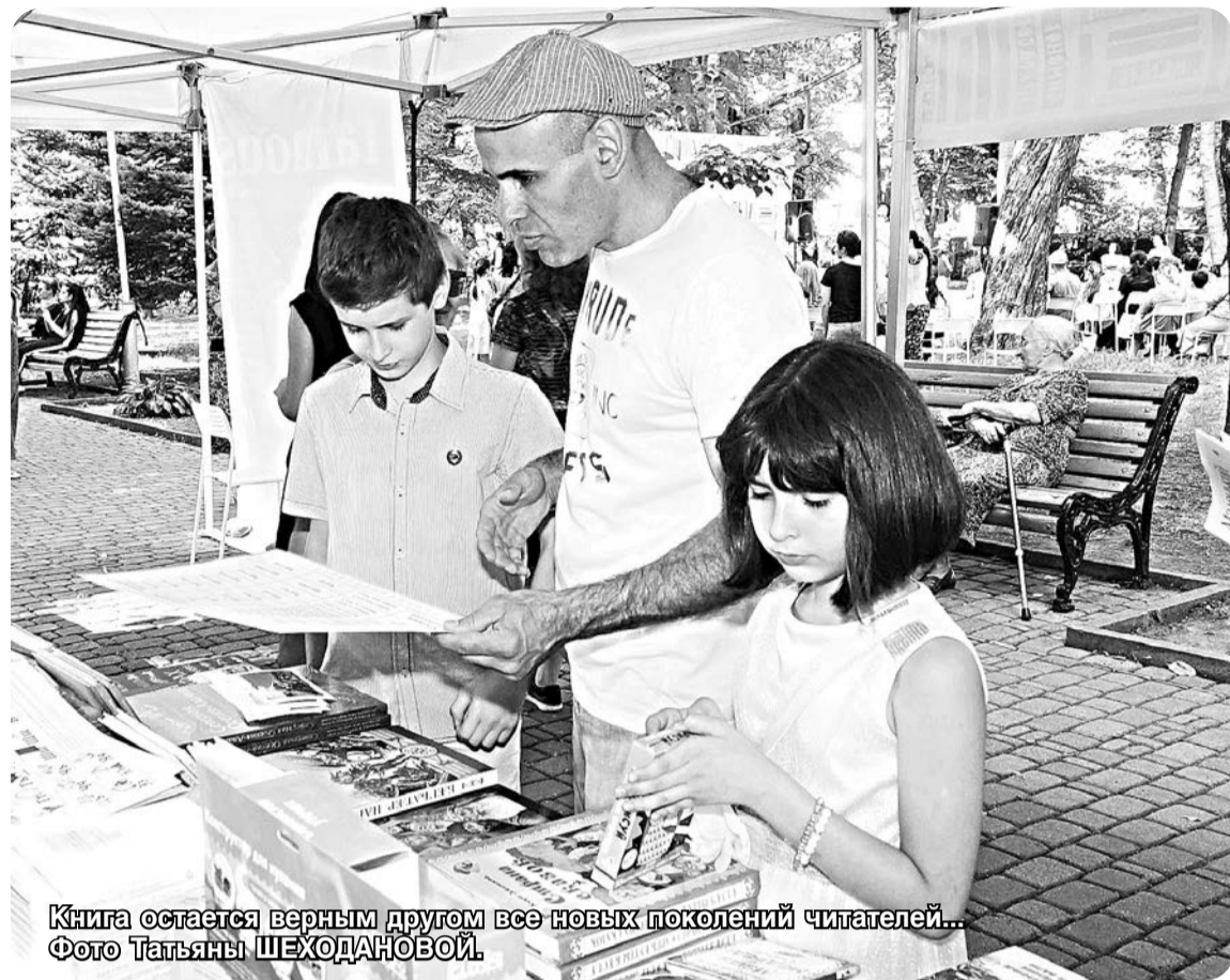
Книга остается верным другом все новых поколений читателей...

Интересно, что наука, которую можно назвать «компасом в книговедении», отходит от принципов «сухого документного оборота». В 90-х годах прошлого века появились принципиально новые по тематике, наполнению и способам раскрытия содержания отражаемых материалов библиографические пособия: очерки, популярные энциклопедии, антологии и хрестоматии, а также путеводители по книгам. Их принято называть жанрами библиографических пособий.