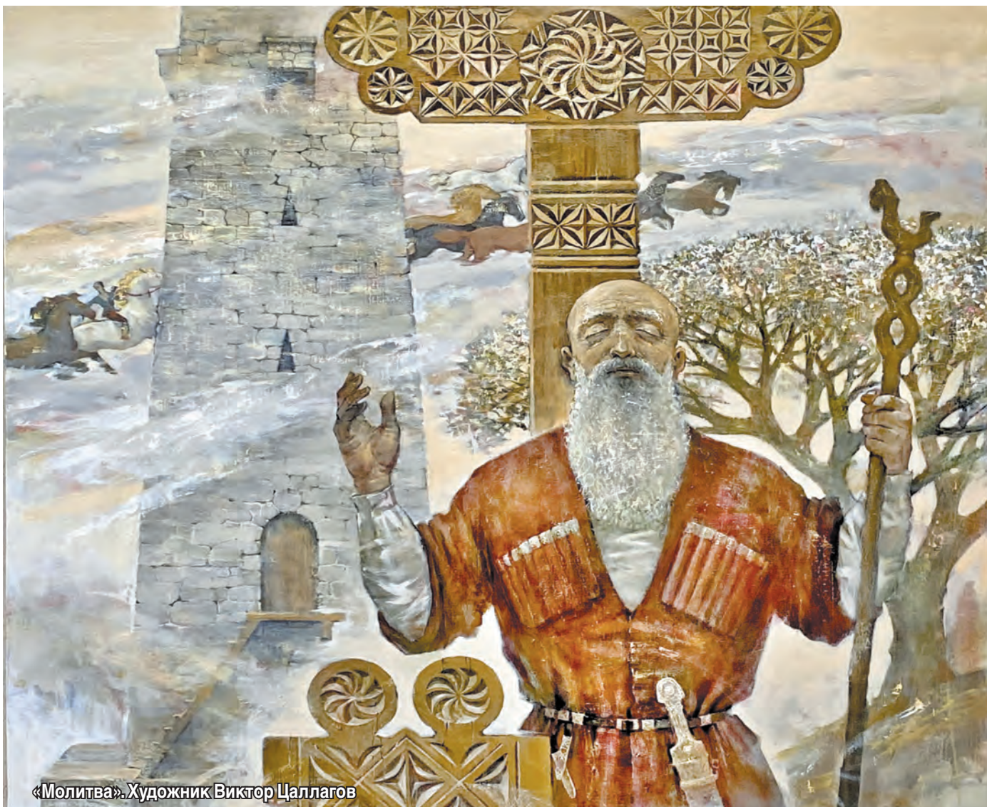
«Молитва». Художник Виктор Цаллагов