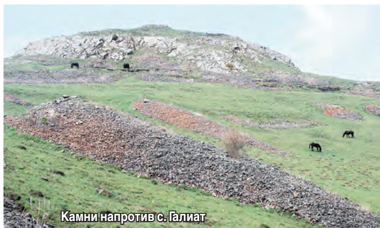
Камни напротив с. Галиат

В наше время в результате освоения горных склонов, дачного и другого строительства видно, что часть каменных куч используется для построек, а другая вскрыта при дорожных работах. В результате этого количество подобных памятников тысячелетней деятельности горцев становится все меньше, особенно вблизи населенных пунктов, дорог, дачных построек. Необходимо бережно относиться к ним и по возможности сохранять.