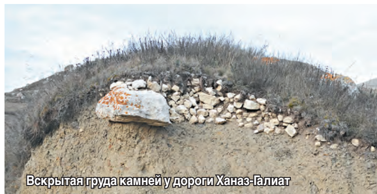
Вскрытая гряда камней у дороги Ханаз-Галиат

Контрастно выделяются в ландшафте каменные кучи на поляне Фаскау, севернее с. Дзивгис.