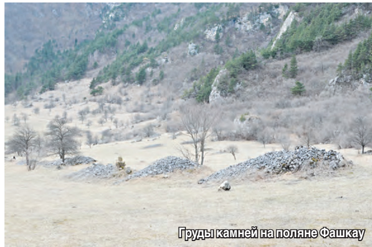
Груды камней на поляне Фашкау

М. Кипиани, обследовавший владения Донифарской общины в Дигории в 1881 г., в работе «От Казбека до Эльбруса. Путевые заметки о нагорной полосе Терской области»