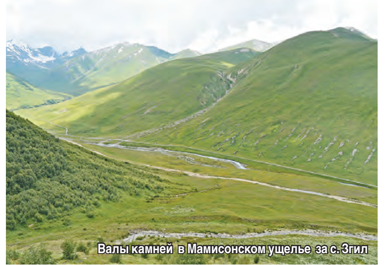
Валы камней в Мамисонском ущелье за с. Згил

Кучи камней в некоторых ущельях такие огромные, что некоторые исследователи их даже называют пирамидами!!! Так, в статье А. Скачкова «Опыт статистического исследования горного уголка» (Терские ведомости», 1905), отмечаются кучи камней, собранных с полей: «Я видел пирамиды камней, сложенных около каждого пахотного