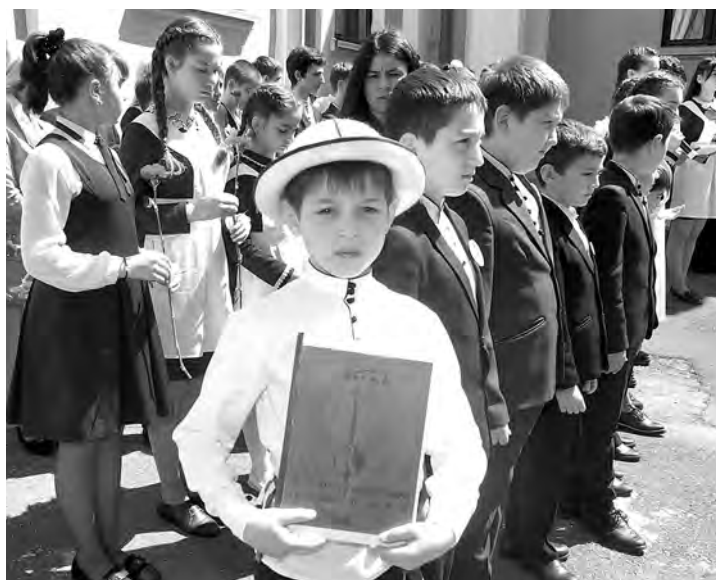
(Окончание на 2-й стр.)

Патетично, но при этом очень искренне – об осетинском языке только так и не иначе. И вчерашний день – как показатель: мы любим и чтим родной язык вовсе не раз в год, иначе бы все эти ребята не смогли так красиво, передавая всю гамму чувств автора, прочитать стихи в честь праздника – Дня осетинского языка и литературы. Через мероприятия, посвященные этому значимому не только для осетин, но и для всех жителей нашей республики и не только дню, начинается задолго до 15 мая – это и различные конкурсы, олимпиады, конференции... Но сам день традиционно начинается с возложения цветов в пантеоне Осетинской церкви: дань памяти основоположнику осетинского языка и литературы Коста Хетагурову отдала глава республики Вячеслав Битаров, председатель парламента Алексей Мачнев, министры культуры и образования Эльбрус Кубалов и Людмила Башарина, глава АМС г. Владикавказ Борис Албегов, а также представители различных органов власти и общественных организаций. Помимо учащихся владикавказской школы №13, которые внесли своей поэтический вклад в это мероприятие, во дворе церкви собрались и ученики других образовательных учреждений.