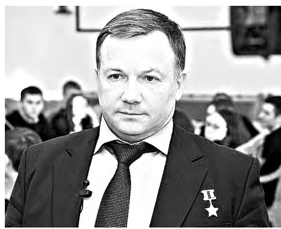
Юрий Валентинович ЛОНЧАКОВ Родился 4 марта 1965 года в г. Балхаше Джезказганской области Казахской ССР.

В актовом зале Республиканского дворца детского творчества им. Б. Кабалоева в минувший понедельник был аншлаги. Сюда со всего города собрались школьники, студенты, ребята из кружков патриотического воспитания, юнармейцы.