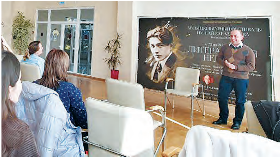
В Северной Осетии проходит мультикультурный фестиваль искусств, посвященный памяти известного писателя Гайто Газданова – «Газданов-фест».

Напомним читателю, что еще в феврале этого года во время своего визита во Владикавказ, писатель Захар Прилепин обратился к руководству РСО-А с инициативой провести на территории республики фестиваль. Задуманное, к счастью, сбылось. В минувший понедельник «Газданов-фест» открыл свое «сердце» для молодых авторов из республик СКФО и других регионов страны.