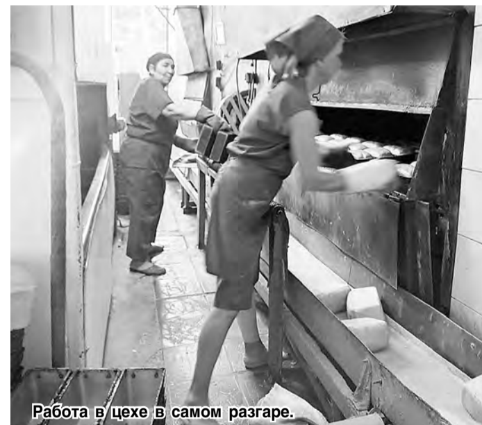
Работа в цехе в самом разгаре.