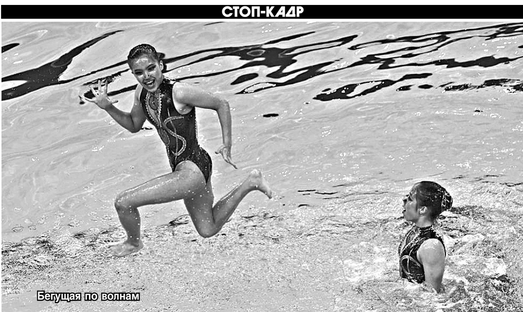
Ведущая по волнам