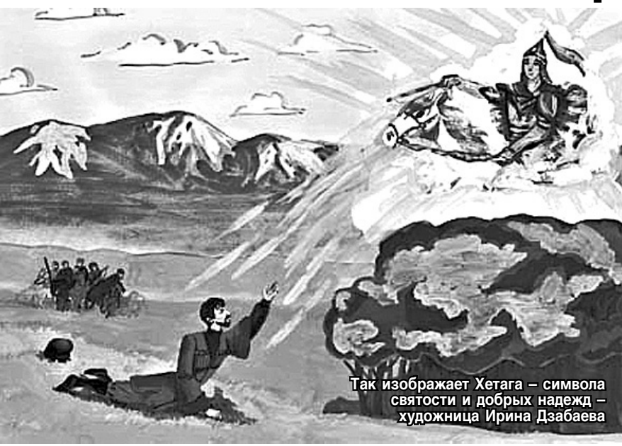
Так изображает Хетага — символа святости и добрых надежд — художница Ирина Дзабаева

— Большой Зеленчук ныне не относится к территории Кабарды, но раньше те земли входили в ее состав. Преследовали Хетага