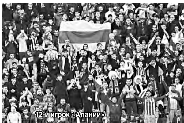
12-й игрок «Алании»