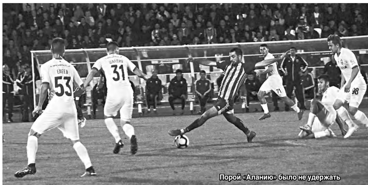
Порой «Аланию» было не удержать