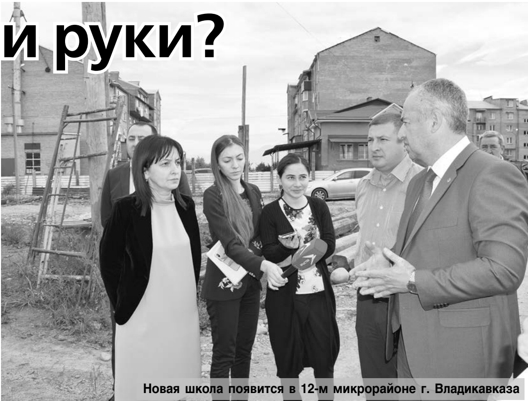
Новая школа появится в 12-м микрорайоне г. Владикавказ

После осмотра объектов в столице республики рейд продолжился в Правобережном районе. Здесь вместе с главой АМС Кон-