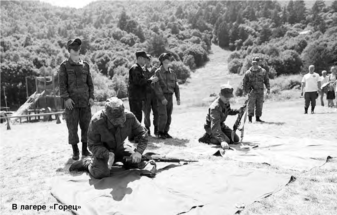
В лагере «Горец»