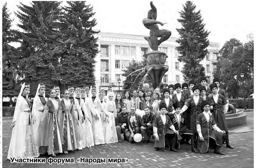
Участники форума «Народы мира»