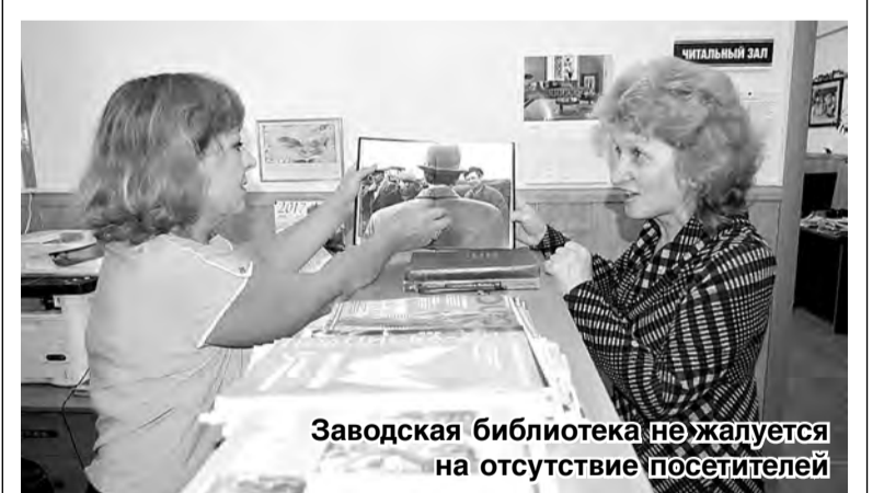
Заводская библиотека не жалуется на отсутствие посетителей

«В один прекрасный день пришла и узнала, что библиотеки уже нет на прежнем месте, – рассказывает читательница. – Стала находить справки и выяснила, что ее перенесли на завод «Электрочинка».