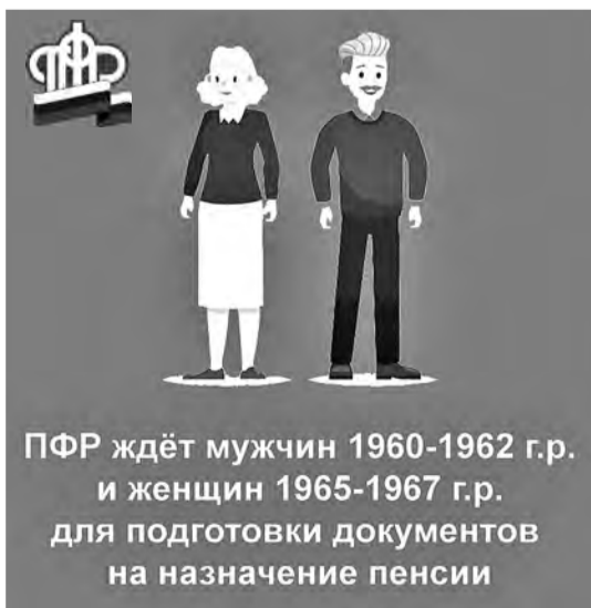
ПФР ждёт мужчин 1960-1962 г.р. и женщин 1965-1967 г.р. для подготовки документов на назначение пенсии

В результате проведения заблаговременной работы будут учтены все пенсионные права гражданина, которые найдут отражение на его индивидуальном лицевом счете. Это позволит гражданину при подаче за месяц до возникновения права заявления о назначении пенсии через личный кабинет на сайте ПФР и проставлении в заявлении отметки о согласии «с принятием решения о назначении пенсии по имеющимся в распоряжении территориального органа Пенсионного фонда сведениям индивидуального (персонифицированного) учета