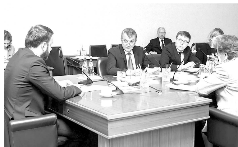
для Владикавказа, создание на территории простаивающих промышленных площадок индустриального парка с перспективным размещением экологически чистых производств...

«Комплексное развитие столицы Северной Осетии затронет все сферы жизнедеятельности города, обеспечит решение накопившихся за многие годы проблем социально-экономического и инфраструктурного характера...»