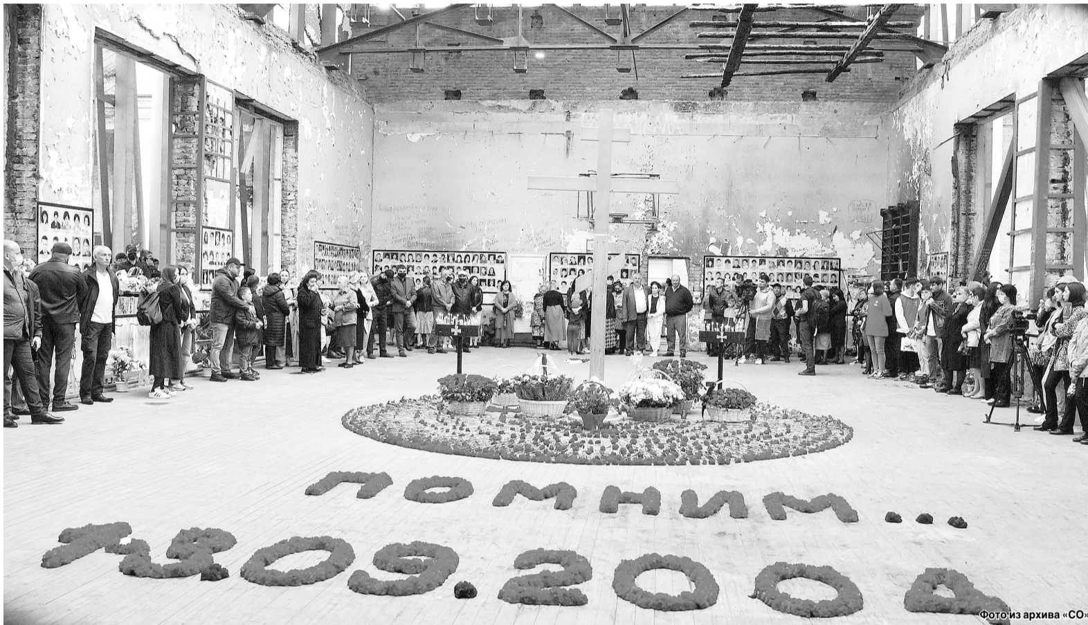
Сегодня жители нашей республики, граждане страны и все неравнодушные люди планеты вновь вспоминают жертв Беслана. 18 лет назад, в 9 часов 15 минут, началась одна из самых страшных трагедий в истории России и мира.