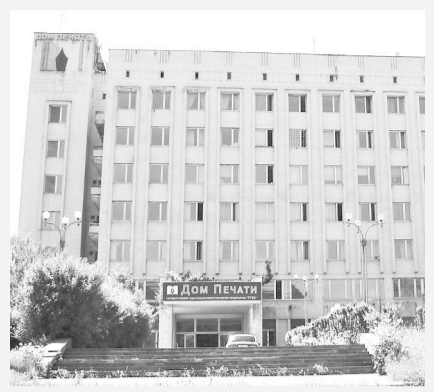
Отдел социальных проблем «СО».