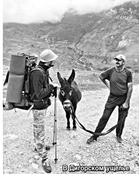
В Дигорском ущелье

ствуете по Кавказу. Расскажите о ваших впечатлениях. – Очень гостеприимный край, теплые и дружелюбные люди. Даже если ты просто попросишь воды, тебя обязательно заведут в дом, накормят, и вы станете как минимум хорошими знакомыми. Я уже несколько месяцев путешествую здесь, был в Чечне, Ингушетии, Кабардино-Балкарии и вот уже почти два месяца нахожусь в Осетии. У вас потрясающая природа, я побывал почти во всех ущельях, очень понравилось Дигорское. В будущем даже есть задумка привозить сюда фототуры – это когда, наслаждаясь природой, люди проходят мастер-классы по фотоделу. А еще во Владикавказе очень много красивых девушек, но по характеру они мне не очень понравились, да и одеваются чересчур вычурно. Думал, здесь одеваются немного поскромнее, такого обилия праздничных нарядов в будни я нигде не видел. – Владикавказ – конечный пункт этого вашего путешествия? – В ближайшие дни я хочу съездить в Южную Осетию на неделю, а потом домой, так как впечатлений очень много,