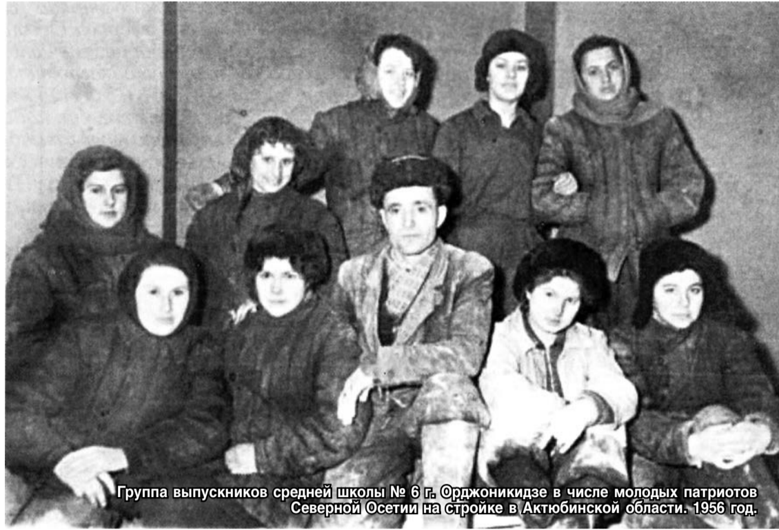
Группа выпускников средней школы № 6 г. Орджоникидзе в числе молодых патриотов Северной Осетии на стройке в Актыбинской области. 1956 год.