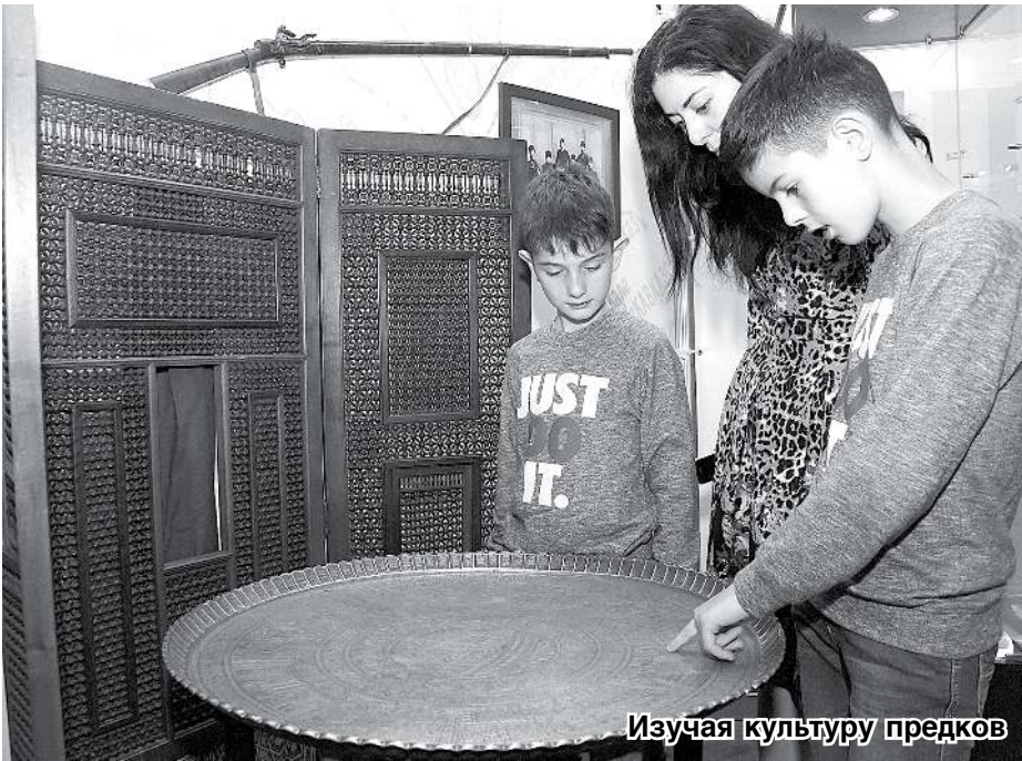
Изучая культуру предков