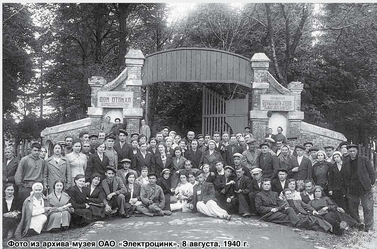
Фото из архива музея ОАО «Электроцинк», 8 августа, 1940 г.

31 июля группа американских туристов посетила Дом отдыха «Электроцинк». Отдыхающие, в числе которых были несколько учителей осетинских начальных школ, радушно приняли гостей. По желанию американских гостей начался волейбольный матч между американцами и отдыхающими. Свисток судьи. Первый тайм – 14:9 в пользу «Электроцинка». Несмотря на все старания американцев, второй тайм закончился для них с еще худшим результатом – 1:14.