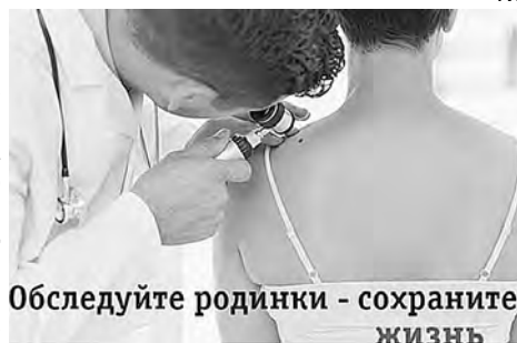
Обследуйте родинки - сохраните жизнь

– Человеку без медицинского образования и даже медику без